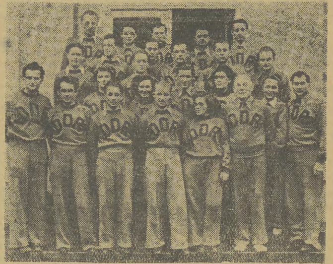
W ośrodku WKKF na Bystrem przebywają obecnie najlepsi narciarze Niemieckiej Republiki Demokratycznej, którzy wraz z narciarzami polskimi przygotowują się do Zimowych Akademickich Mistrzostw Świata. Na zdjęciu ekipa narciarzy i narciarek niemieckich.