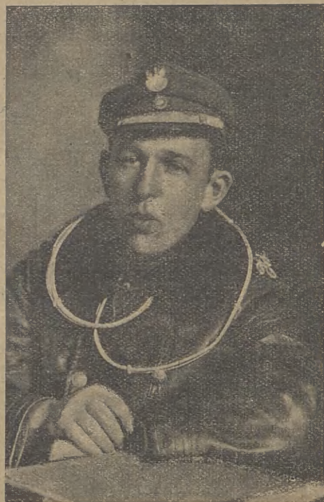
KAP. MOND.

Ale ranek 1-go listopada okazuje Lwowianom nietylko żółto-niebieskie chorągwie na ratuszowej wieży, a w ślad za tem przed łańską katedrą kałużę polskiej krwi — ofiar niewinnych bezmyślnej a zbrodniczej strzelaniny ukraińskiej. Mówi on także, że gwałt się gwałtem odciska. Już we wczesnych godzinach Kom. Mączyński po koniecznym zasileniu redut rozpoczyna akcję mobilizacyjną z punktem zbornym kościół św. Elżbiety; rozlegają się strzały w ul. Batorego — nieliczne, ale bo to początek: P. O. W. zdobywa broń na patroli ukraińskiej; na Kopytkowem ppor. Feldstein zabiera pogotowiu policyjnemu 20 Werndli i około 300 naboju a sierżant Nowi przy ul. Szeptyckich równie mały skład broni, grupa z Domu Technicznego śmiałym napadem zyskuje broń w szpitalu rezerwowym na Politechnice, dow-