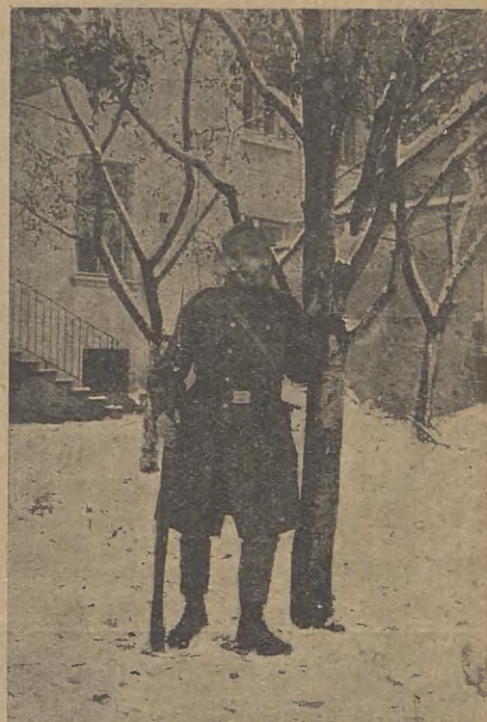
ŻOŁNIERZ LWOWSKICH W. P. STARSZE POKOLENIE.

Dzień 31-go października sprowadził do Lwowa przedstawiciele stowarzyszeń studenckich z całej Polski, bo 1-go listopada rozpoczynały się obrady Zjazdu wszystkich organizacyi ideowych polskiej młodzieży akademickiej. „Warszawa—Kraków—Lwów—Kijów—Moskwa“ są wymienione pod uchwałami Zjazdu, ogłoszonymi w polskich dziennikach lwowskich z 3/XI. Zjazd należycie ocenił zamach stanu dokonany przez t. zw. Radę Narodową