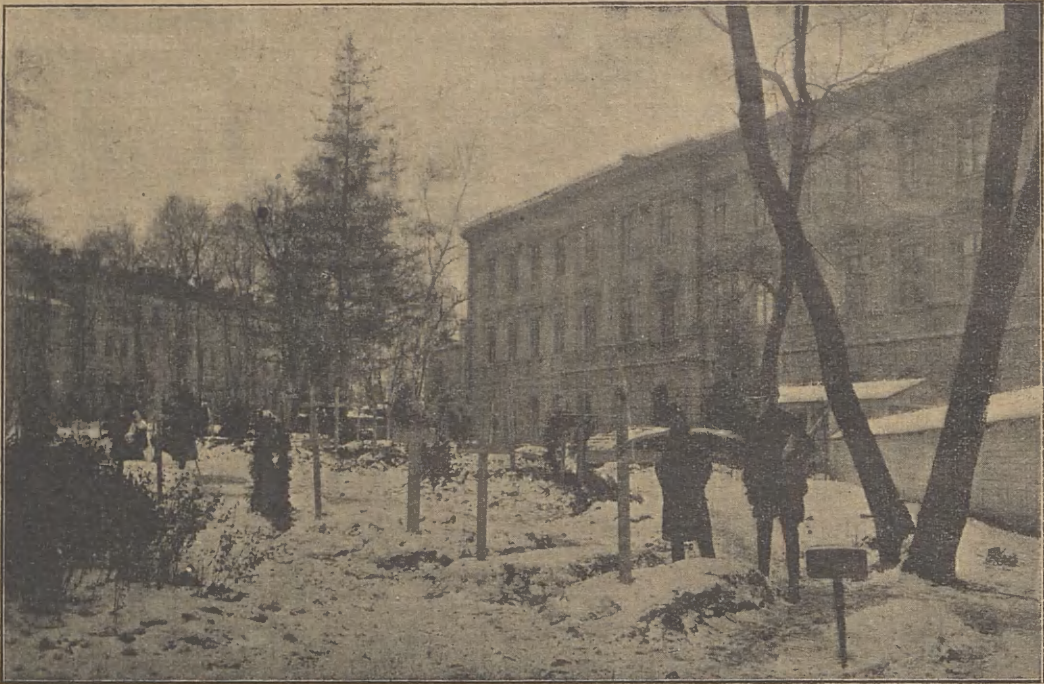
CMENTARZ OBOK PRAWEGO SKRZYDŁA POLITECHNIKI.

Na czterech cmentarzykach: koło Techniki, Szkoły Sienkiewicza, w obrębie Szkoły Kaddeckiej i przy ul. Bema spoczęli rycerze walczącego Lwowa. W tej samej polegli potrzebie,