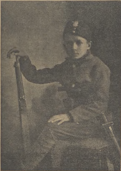
ŻOŁNIERZ LWOWSKICH W. P. MŁODZIUTKI TELEFONISTA.

Rozległe ziemice polskiej Rzeczypospolitej były więc szczęśliwym zbiegiem okoliczności zastąpione w walce Lwowa o zrzucenie jarzma, co niespodzianie nań spadło. Przynależność Lwowa do Polski zaraz w pierwszej chwili jego powrotu do Macierzy zadokumentowano najdobitniej tym węzłem wspólnie przelewanej krwi.