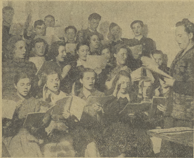
W Karolinie pod Warszawą kształci się 20 utalentowanych dzieci, skierowanych tam po specjalnym konkursie, zorgan- izowanym dla wyłowienia talentów muzycznych wśród wiej- skiej i robotniczej młodzieży.