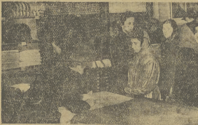
Spółdzielnia Pracy „Spółnota” uruchomiła w Rynku Gł. 10, czwartą placówkę sprzedaży na terenie Krakowa. — Nowy sklep jest zaopatrzone w towary galanteryjne i konfekcyjne. Z początkiem przyszłego roku nastąpi dalsza jego rozbudowa. Na zdjęciu widzimy klientów zaopatrujących się w towary pierwszej potrzeby