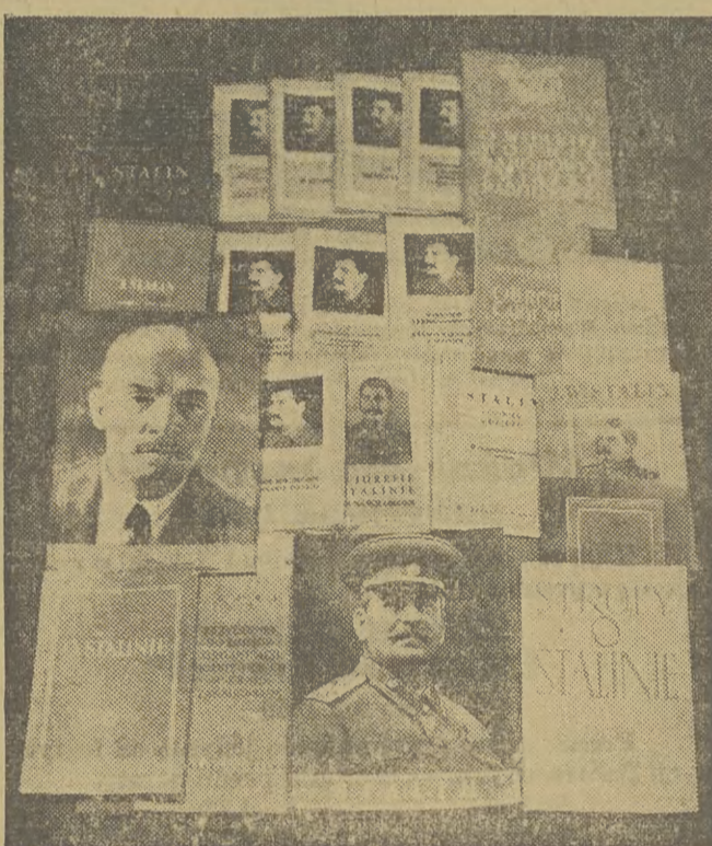
Nowe polskie wydanie dzieł Józefa Stalina i książek o Stalinie

Z optymizmem i wiarą patrzymy w przyszłość. Zwycięstwa ubiegłego roku są dowodem stałego wzrostu sił światowego obozu pokoju i postępu. Zacieśniając przyjaźń ze Związkiem Radzieckim i z wszystkimi narodami demokratycznymi, wznagając czujność na machinacje wrogów, siły postępu pokój utrwała i rozgromia zieleń i niszczycielskie sily wojny, ciemnoty i zafarbia.