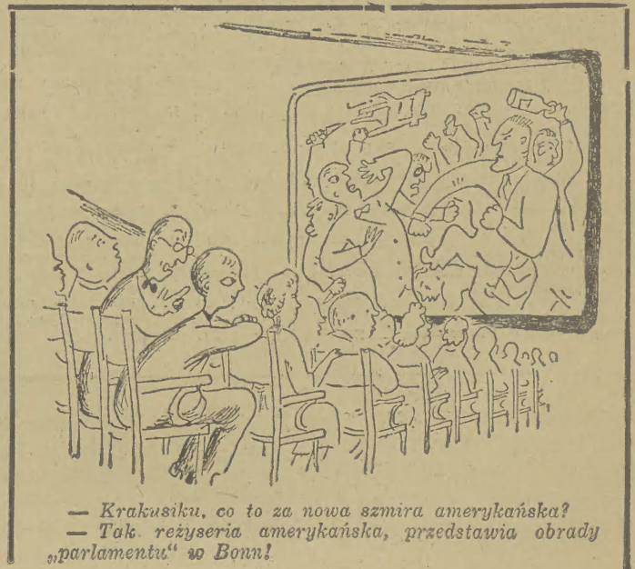
— Krakusiku, co to za nowa szmira amerykańska? — Tak reżyseria amerykańska, przedstawia obrady „parlamentu” w Bonn!