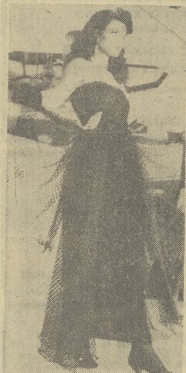
W HOTELU „Atrium Hyatt” w Budapeszcie odbył się ostatnio pokaz mody projektowanej przez Pierre'a Cardina. Oto jedna z propozycji — wytworna suknia wieczorowa.

MADRYT — 3,3-milionowa stolica Hiszpanii, jest obecnie jednym z najbardziej hałaśliwych miast Europy. Przeszło połowa madryckich ulic wykazuje natężenie hałasu znacznie powyżej międzynarodowej normy uznanej za górną dopuszczalną granicę, tj. 70 decybeli. Hałas powodują głównie pojazdy mechaniczne, w tym — bardzo popularne tu motocykle. Głośno jest także nocą, m. in. za sprawą nocnych lokali. Władze miejskie przygotowują kompleksowy program ograniczenia hałasu m. in. przez budowę specjalnych ekranów izolujących oraz dodatkowych ciągów ulicznych rozgęszczających zmotoryzowany ruch uliczny. Realizacja programu kosztować będzie równowartość kilkuset milionów dolarów. (X)