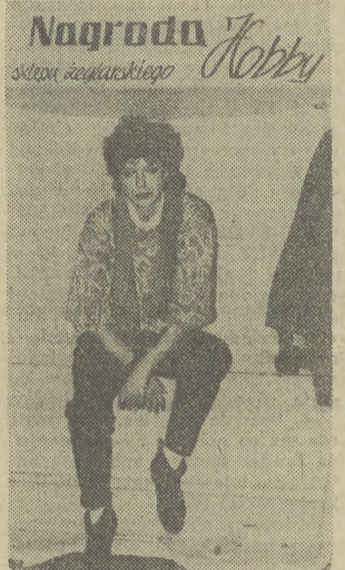
Nagroda Józka JAK widać organizatorzy festiwalu SHANTI'ES '89 przygotowali atrakcyjne nagrody. Ciekawe, czy ta jest stała, czy przechodnia?