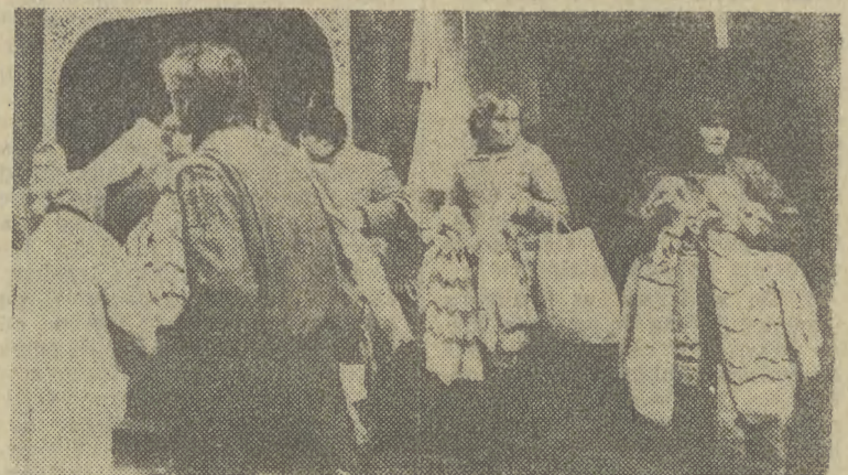
SADZAC po liczbie handlarek, sprzedających swetry na ulicach, wraca tego zima...