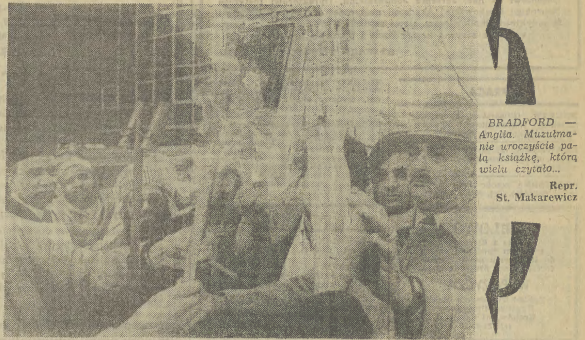
BRADFORD — Anglia. Muzulmanie uroczystość pałą książkę, którą wielu czytało...