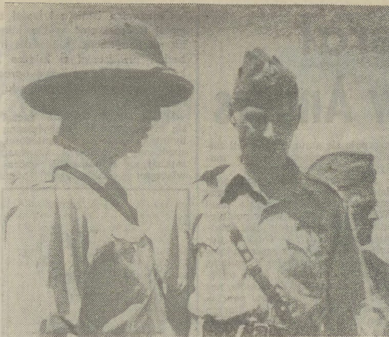
Na zdjęciu: generałowie W. Sikorski i W. Anders.