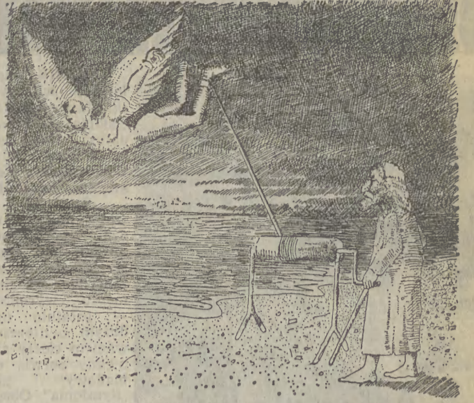
Rys. Piotr Bielecki

Hiszpanie będą musieli zrezygnować z corridy, chyba że stanie się ona o wiele mniej okrutna — tę myśl zawiera raport specjalnej komisji Parlamentu Zachodnioeuropejskiego do spraw ochrony środowiska naturalnego, zdrowia i wyżywienia. Komisja wysunęła postulat nowelizacji istniejącego w ramach EWG ustawodawstwa dotyczącego ochrony przyrody, domagając się zakazu publicznych aktów przemocy nad zwierzętami, choćby za cenę zerwania z narodową tradycją.