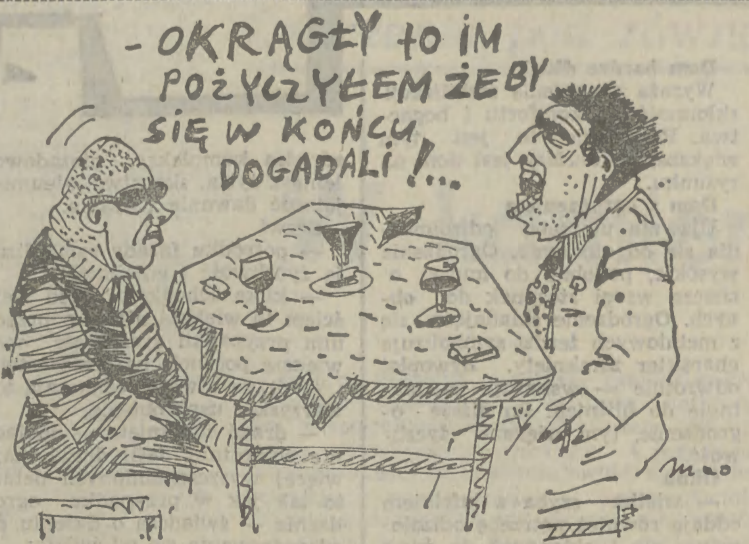
Rys. Marek Olszyński

Wydaje się jednak, że kryzys ozonowy już minął. Zauważono że obie dziury — zarówno na północ, jak i na południe — stopniowo zaczynają się zmniejszać. Największy zasięg dziury nad Antarktydą przypadł na koniec 1987 r., kiedy ilość ozonu zmniejszyła się o połowę. Od tego czasu jednak ozonu zaczęło przybywać, a dziura szybko zmniejszyła swój zasięg. Być może takie dziury są zjawiskiem naturalnym, powtarzającym się co kilka lub kilkanaście lat. Wcześniej ich nie zauważyliśmy, gdyż nie robiono takich badań! Regularne pomiary ozonu będą jednak prowadzone także w przyszłości, co być może pozwoli poznać zagadkę ozonowych dziur. (PAP)