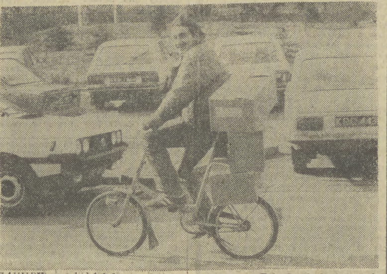
ZAKUPY na niedzielę?