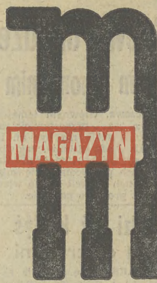
Fot. Jacek Bednarczyk