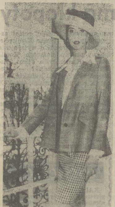
OSTATNIE propozycje Christiana Diora na sezon wiosenno-letni 1989 wyróżniają się prostotą, elegancją i urodą modelek

W 1709 r. zmarł w wieku 65 lat książę Francois de Bourbon Conti, który dzięki zabiegom posła francuskiego w Polsce, M. Polignaca, został wybrany w 1697 r. królem Polski; przybył wówczas do Gdańska, ale wobec objęcia tronu przez Augusta III Sasa wrócił do Francji. (f-k)