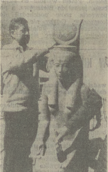
SPECJALIŚCI twierdzą, że odnalezienie w styczniu w ruinach świątyni Luksoru w Egipcie pięciu posągów, jest największą sensacją archeologiczną ostatnich lat. Na zdjęciu: czyszczenie jednego z posągów.