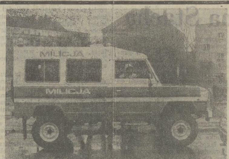
FABRYKA Samochodów Rolniczych w Poznaniu opracowała kilka wersji „tarpan-honker 4011” z nakładką „top hard”, specjalnym wyposażeniem i oznakowaniem. Jedną z nich będzie stopniowo zastępowała „uazy” używane przez MO. Na zdjęciu: „tarpan-honker” dla milicji.

sprzedaż karnetów nie odebranych przez zakłady pracy. — INDYWIDUALNIE — na zamówienia zbiorowe — NORMALNE I ULGOWE OPRF, ul. Smoleńsk 2, II p., p. 213 — codziennie, 9—13. ZAPRASZAMY — DUŻY WYBÓR — ZAPRASZAMY