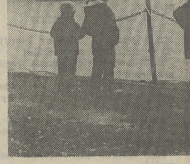
Fot. Jacek Bednarczyk

Przy al. Rewolucji Październikowej brygady remontowe MPK pracują pod czujnym okiem „kibiców”. Czyżby w ten sposób okoliczni mieszkańcy chcieli dopomóc w należytej wykonania robót? Fot. Jacek Bednarczyk