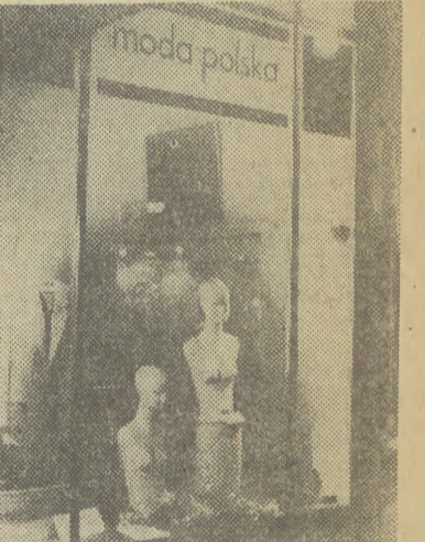
Polska moda na kryzys?

W ZWIĄZKU z przekopem ul. Koberzyńskiej od dnia 1989-02-14 godzina 9.00 do dnia 1989-03-31 autobusy linii „106”, „114” i „166” będą kursowały przez ul. Grota Roweckiego.