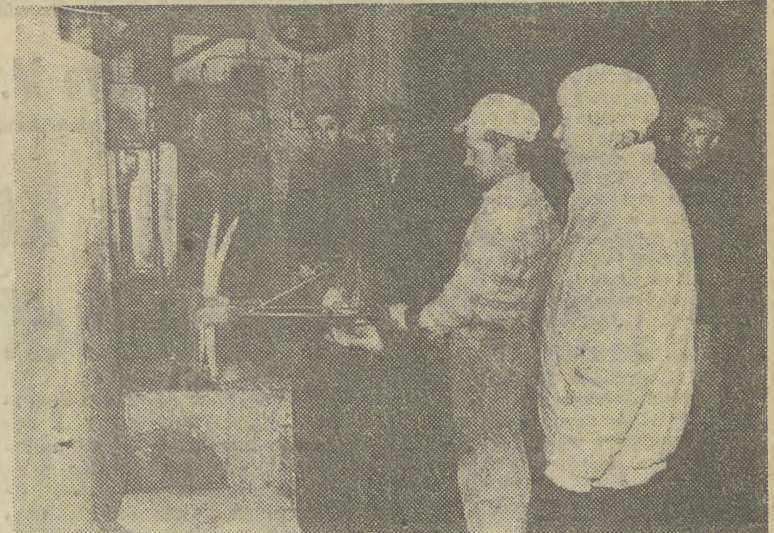
ZWIEDZAJĄCY mieli możliwość obejrzeć z bliska pracę kowali.

MOŻNA się spodziewać, że bieżący tydzień przyniesie ożywienie dyskusji w ramach prac „okrągłego stołu”. Spór o konkretne, szczegółowe rozwiązania różnych problemów z pewnością wyrazi się już dotychczas zarysujecie niezbędne granice kompromisu. Dziś na swym drugim już posiedzeniu zbiorą się uczestnicy zespołu ds. gospodarki i polityki społecznej. W najbliższą środę 15 bm. natomiast po raz pierwszy spotkają się uczestnicy podzespołu ds. rolnictwa. Czwartek 16 lutego — to drugie już posiedzenie zespołu ds. pluralizmu związkowego. W piątek 17 bm. obradować będą na swych pierwszych posiedzeniach: podzespół ds. górnictwa oraz podzespół ds. środków masowego przekazu. (PAP)