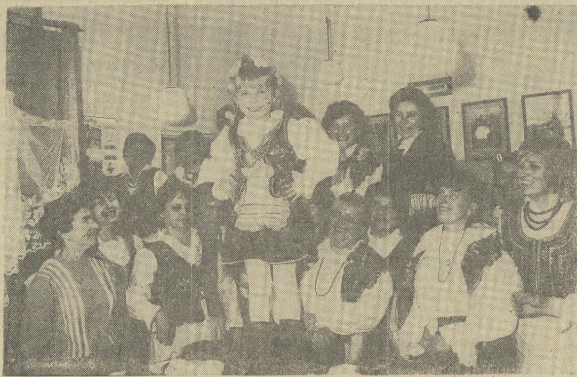
Obserwacje pewnego wypadku