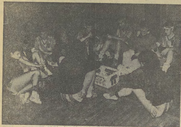
ZAWODNICZKI angielskie odpoczywają podczas przerwy.