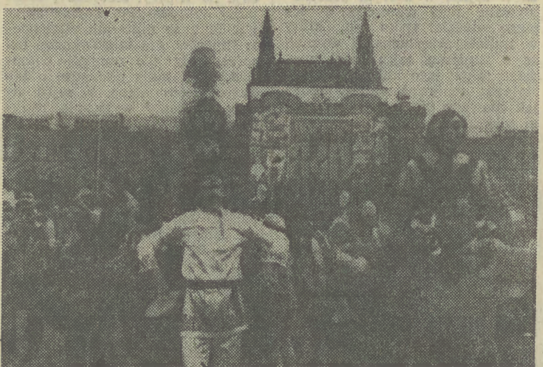
Tradycyjne Dni Moskwy były połączone w tym roku z obchodami 840-lecia stolicy ZSRR i dedykowane zbliżającej się 70. rocznicy Rewolucji Październikowej. Na zdj.: barwny korowód na Placu Czerwonym.