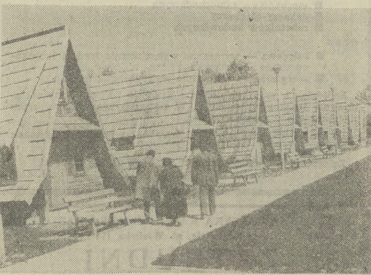
9 DOMKÓW drewnianych prezentuje się okazale... czekają na gości.