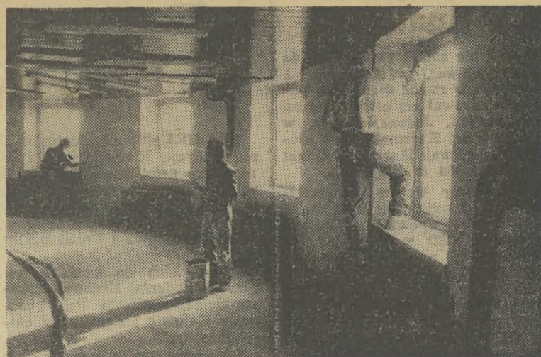
A jednak nie myśla wieża

A swoją drogą szkoda, że mamy tyle kłopotów w domowym przetwórstwie, pomidory obrodziły i owoce też.