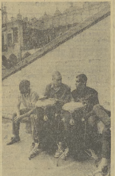
I na Rynku można usłyszeć afrykańskie tam-tamy.

JUTRO pogoda w rejonie Krakowa kształtować się będzie w obszarze obniżonego ciśnienia. Zachmurzenie przeważnie duże, okresami deszcz. Temp. min. nocą 11, dnem 18 st. C. Wiatr słaby, zmieniły. Dziś rano wilgotność powietrza wynosiła 84 procent.