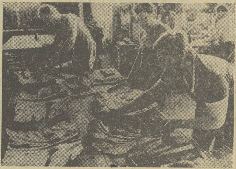
W najpiękniejszej budowli barokowej Drezna — Zwingerze trwa renowacja Bramy Koronnej. Brama ta została zaprojektowana w okresie panowania Augusta Mocnego i jest dziełem M. D. Poepelmana. Na zdj.: złotnicy restaurują elementy Bramy.