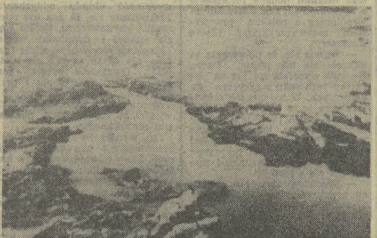
Jezioro Nios w Kamerunie

UTRO pogoda w rejonie Krakowa kształtowała się będzie w zatoce niżowej. Zachmurzenie duże z wielkimi przejaśnieniami, okresami deszcz, możliwa burza. Temp. min. nocą 10, maks. dniem 19 st. C. Wiatr stały i umiarkowany płn.-wsch. skreślający na zach. Dzisiaj rano wilgotność powietrza wyniosła 90 proc.