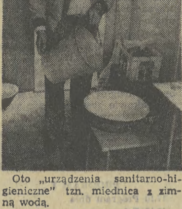
Oto „urządzenia sanitarno-higieniczne” tzn. miednica z zimną wodą.