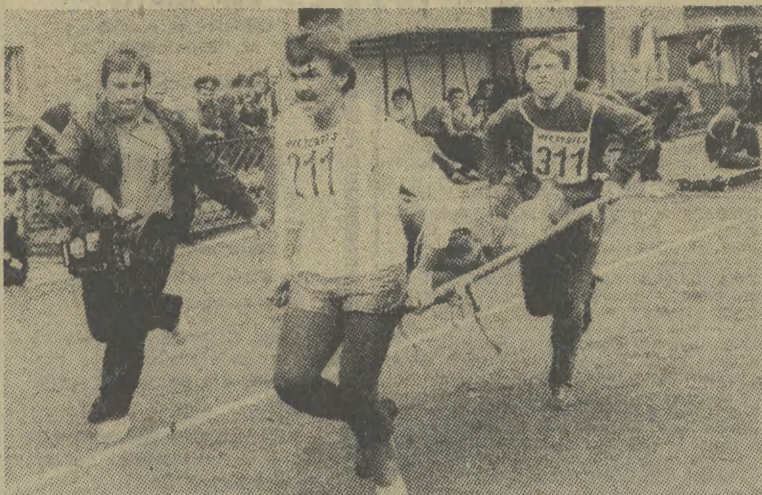
W Chorzowskim Ośrodku Harcerskim przebywali uczestnicy Międzynarodowych Obozów Przyjaźni Organizacji Obronnych Państw Socjalistycznych z Czechosłowacji, Bułgarii, NRD, ZSRR i Polski. Na zdj.: podczas zawodów na 400-metrowym torze przeszkód.