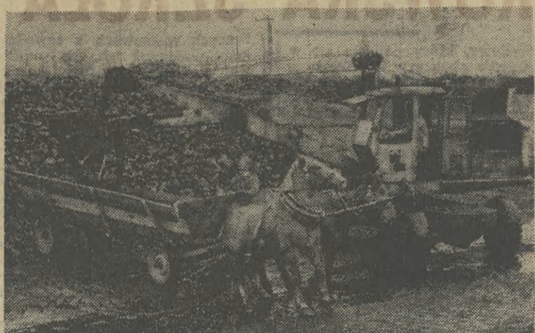
W składzie opalowym przy ul. Prądnickiej nawet po południu jest spory ruch. Operator koparki Czesław Kalandrzyk ładuje węgiel na wóz Edmunda Ziętarego z Witkowic.