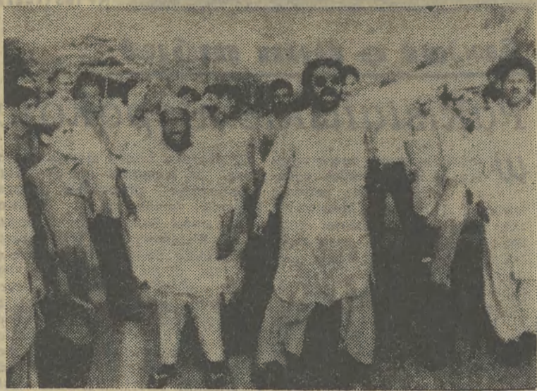
W Karaczi i innych miastach Pakistanu dochodzi do demonstracji antyrządowych w związku z aresztowaniem czołowej działaczki opozycyjnej Benazir Bhutto. O sytuacji w Pakistanie piszemy szerzej na str. 2.