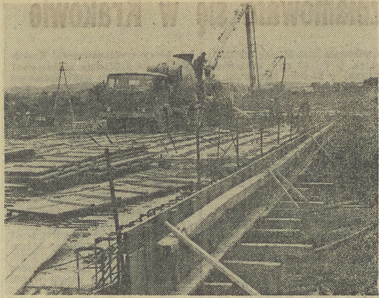
Na budowie autostrady — wiadukt ponad torami kolejowymi

Dla Krakowa najważniejsze jednak będzie poprowadzenie autostrady dwoma zaprojektowanymi obwodnicami: północną — przez Modlniczkę do Węgrz i południową — przez stopień wodny na Wiśle „Kościuszkę”, Tyniec do Opatkowic (połączenie z trasą zakopiańską). W pierwszej kolejności — według ustaleń Ministerstwa Komunikacji — prace zostaną podjęte na obwodnicy w kierunku stopnia wodnego „Kościuszkę”. Ich sfinalizowanie potrwa jednak sporo lat, byleśmy zdążyli przed XXI wiekiem! (ja)