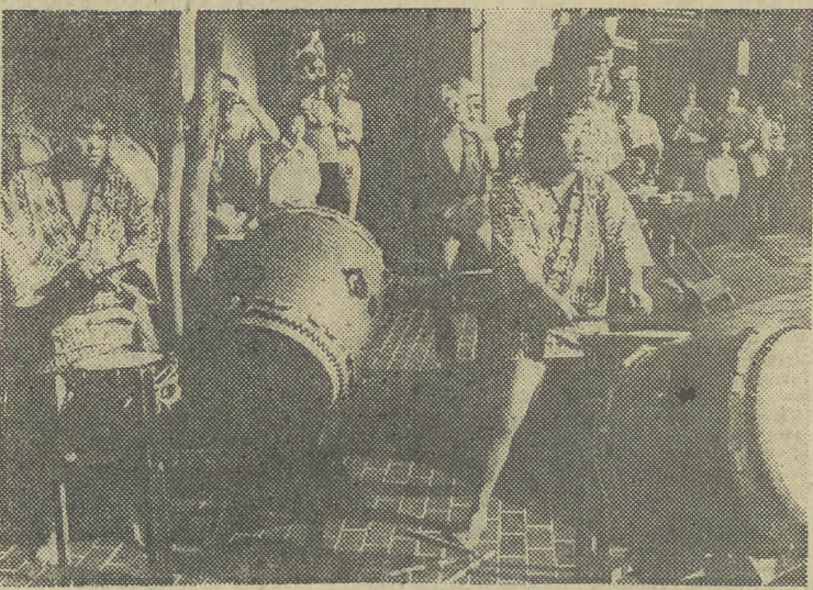
Japoński zespół folklorystyczny w dzielnicy japońskiej Los Angeles.