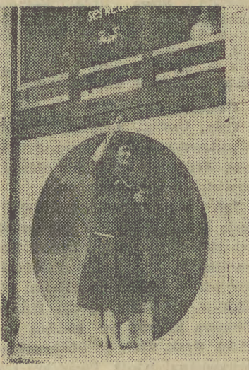
Można i tak dbać o wygląd placówki handlowej, jak czyniła to ekspedientki w sklepie tekstylnym przy ul. 18 Stycznia 14.

Jak wakacje to oczywiście wyjazdy z dala od miasta, nad rzeki, jeziora, w góry lub nad morze. Takie jest obiegowe pojęcie o wypoczynku. A tymczasem kiedy my ciągniemy masowo nad morze, do nas przyjeżdżają właśnie stamtąd i to o zgrozo, by spędzić wakacje w najbardziej zadymionym i zanieczyszczonym krakowskim powietrzu. O tym czy pomysły jest słuszny rozmawiam z panem Mirosławem Nowakowskim, kierownikiem jednej z kończących się właśnie dzisiaj kolonii. Byliśmy w Krakowie prawie trzy tygodnie i chyba nie ma takiego dziecka, które nie byłoby z tej kolonii zadowolone. Zwiędziliśmy wszystko, co tylko się dało. Większość dzieci widziała Kraków po raz pierwszy i jest urzeczona miastem. Ile było dzieci? - 139 i 8 wychowawców. Z jakich miejscowości przyjeżdżały do nas? - Przede wszystkim z nadmorskich wiosek, z kombinatów rolniczych. Czy tylko zwiędziały w Krakowie zabytki? - Ależ skąd. Mieszkaliśmy w miasteczku studenckim. Świetnie położone, bo z jednej strony z dala od centrum, a z drugiej wszędzie bardzo blisko. Chodzi-