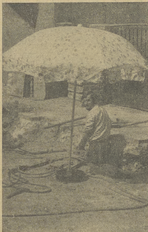
Parasol to nie luksus...