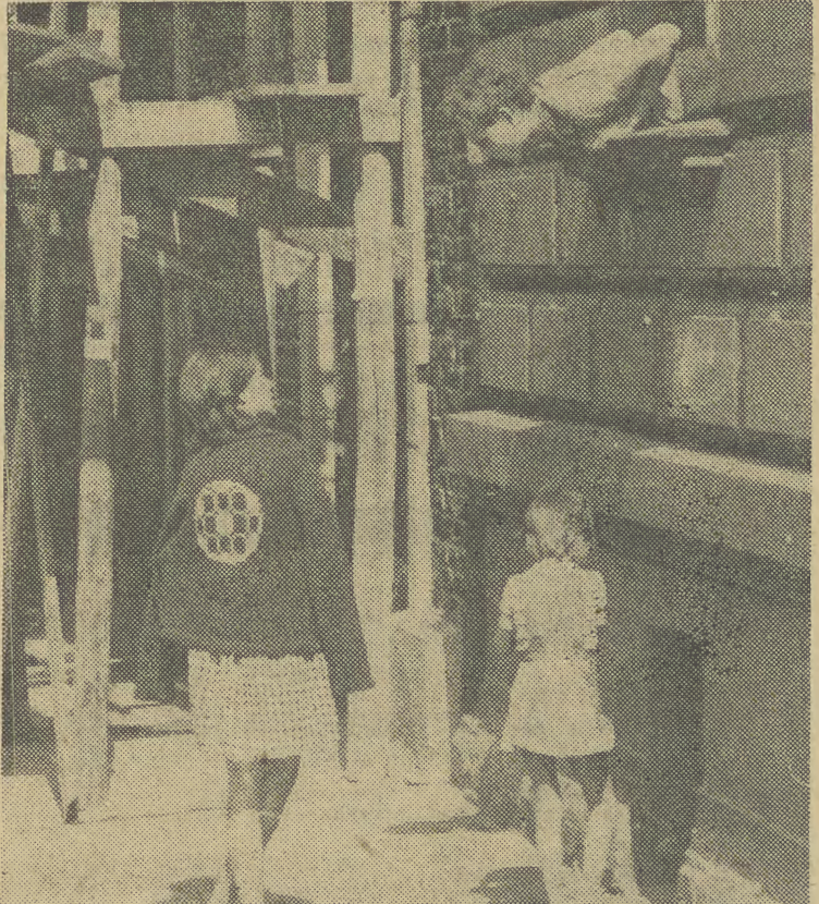
Czyżby przeniesiona w dzisiejsze realia scena z Romea i Julii?

Duże natężenie ruchu na drogach dojazdowych do Krakowa utrzymywało się do godz. 21. (ms)