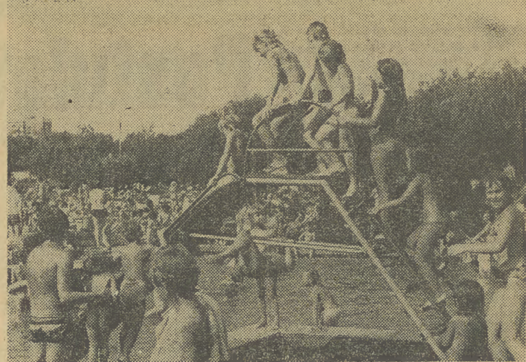
Na basenie przy ul. Eisenberga w niedzielę padł chyba rekord tego lata — ponad 3 tys. osób, które szukały ochłody w basenie i brodzikach.