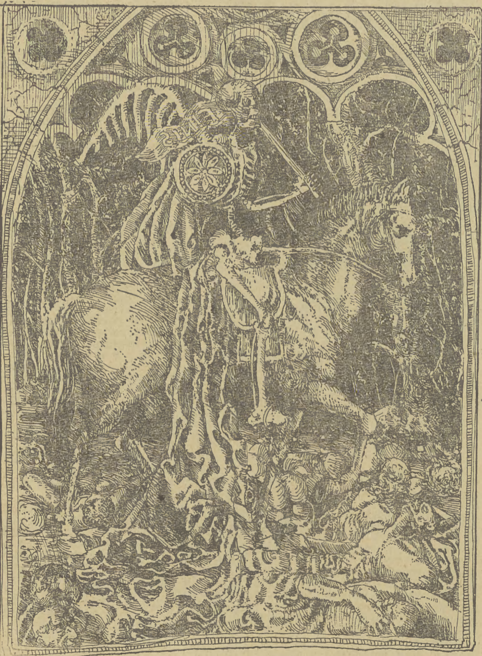
Rys. PIOTR BIELECKI

Dżuma, bardzo zaraźliwa, gwałtowna, groźna dla życia choroba, wywołana przez pałeczkę dżumy; przenoszona na ludzi ze zwierząt, głów nie szczurów, przez pchły lub przez kontakt z chorym; ogniska dżumy i stnieją w niektórych rejonach Azji i w środkowej Afryce.