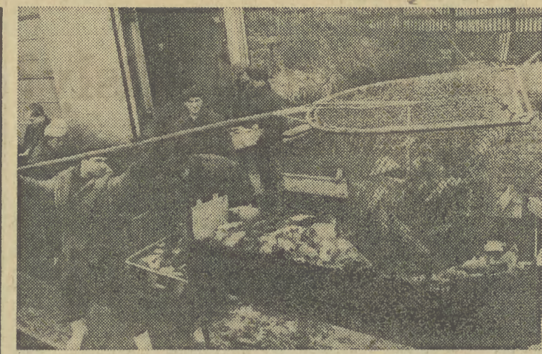
W bronowickich magazynach praca w dzień i noc...