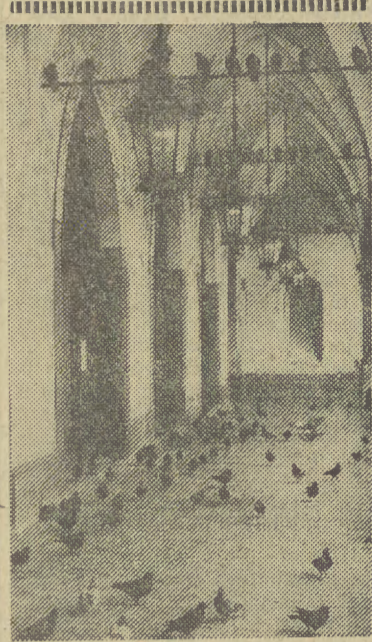
Aura zmusza gołębie do szukania schronienia pod arkadami Sukiennic.

Wielu Polaków jest oburzonych tym, że kiedy dziennikarze z Niemiec Zachodnich zapytali Lecha Wałęsę, co myśli o kwestionowaniu w RFN polskiej granicy zachodniej, on uchylił się od odpowiedzi; stwierdził, że na ten temat nie chce mówić. Czy pan Wałęsa zareagował jakoś na ujawnienie przez rzecznika rządu, że jest on prawie jedynym Polakiem, który nie mówi, że nasza granica na Odrze i Nysie jest nienaruszalna (Polskie Radio)?