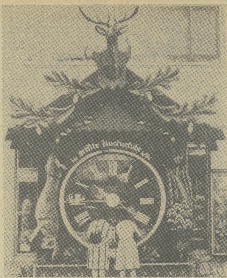
Największy na świecie zegar z kukułką zainstalowany jest od 1946 roku w witrynie zakładu zegarmistrzowskiego w Wiesbaden (RFN). Ręcznie rzeźbiony zegar ma wysokość 5,25 m, a sama tarcza — 2,6 m.