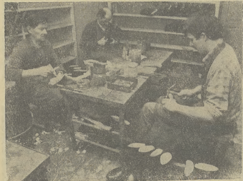
W spółdzielni „Dobek” pracuje się w trudnych warunkach i ciągle jeszcze metodami tradycyjnymi.

KZSP zadeklarował pomoc spółdzielni w wyjściu z trapiących ją kłopotów, proponując modernizację obiektów spółdzielczych oraz zakup nowoczesnych maszyn. Może więc już wkrótce obuwie z „Dobka” będzie ładniejsze i wróci na krakowski rynek w większych ilościach, może nawet będzie poszukiwanym towarem. (RD)