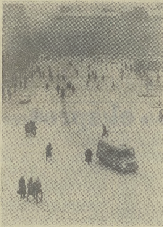
Wreszcie śnieg na krakowskim Rynku. Ciekawe tylko, czy dotrwa do Świąt...

Prezes Rady Ministrów, gen. armii Wojciech Jaruzelski przekazał prymasowi Polski, kardynałowi Józefowi Glempowi życzenia w związku z 55. rocznicą urodzin. W dniu swoich urodzin J. Glemp przebywał — w ramach obowiązków duszpasterskich — w Gnieźnie. Z okazji urodzin złożono prymasowi serdeczne gratulacje i życzenia. (PAP)