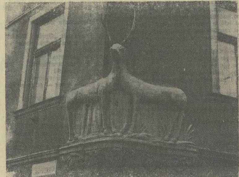
Nie zdarza się chyba w przyrodzie takie curiosum, żeby istniało zwierzę o dwóch tułowach i ośmiu nogach tudzież jednej głowie. Ale widać, nie przeszkadzało to budowniczym kamienicy przy zbiegu Rynku Podgórskiego (nr 11-12) i Kazimierza Brodzkiego. Kamienica ta wzniesiona w stylu klasycystycznym w końcu XVIII stulecia jest jednym z nielicznych zabytków Podgórza i pamięta jeszcze czasy, gdy tę dzielnicę Krakowa zwano Josephstadt. (RD)

● Miniona doba na drogach województwa i ulicach Krakowa upłynęła pod znakiem 6 wypadków i 5 kolizji. Ran doznało 8 osób.