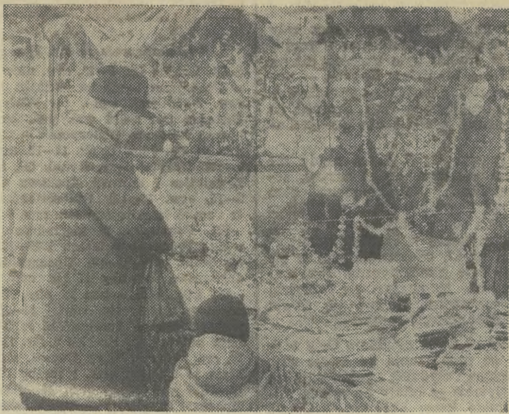
Stojąc przed którymkolwiek z takich straganów zapominają się o codziennych kłopotach zaopatrzeniowych. Czujemy świąteczną atmosferę.