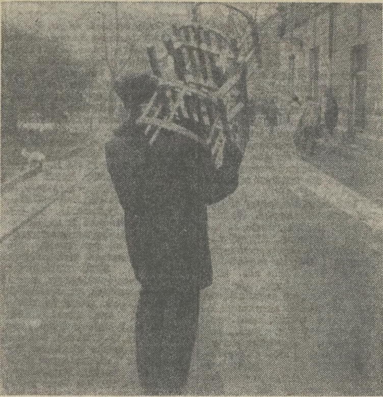
Dobrze, dobrze, ale kto to będzie ciągnął?