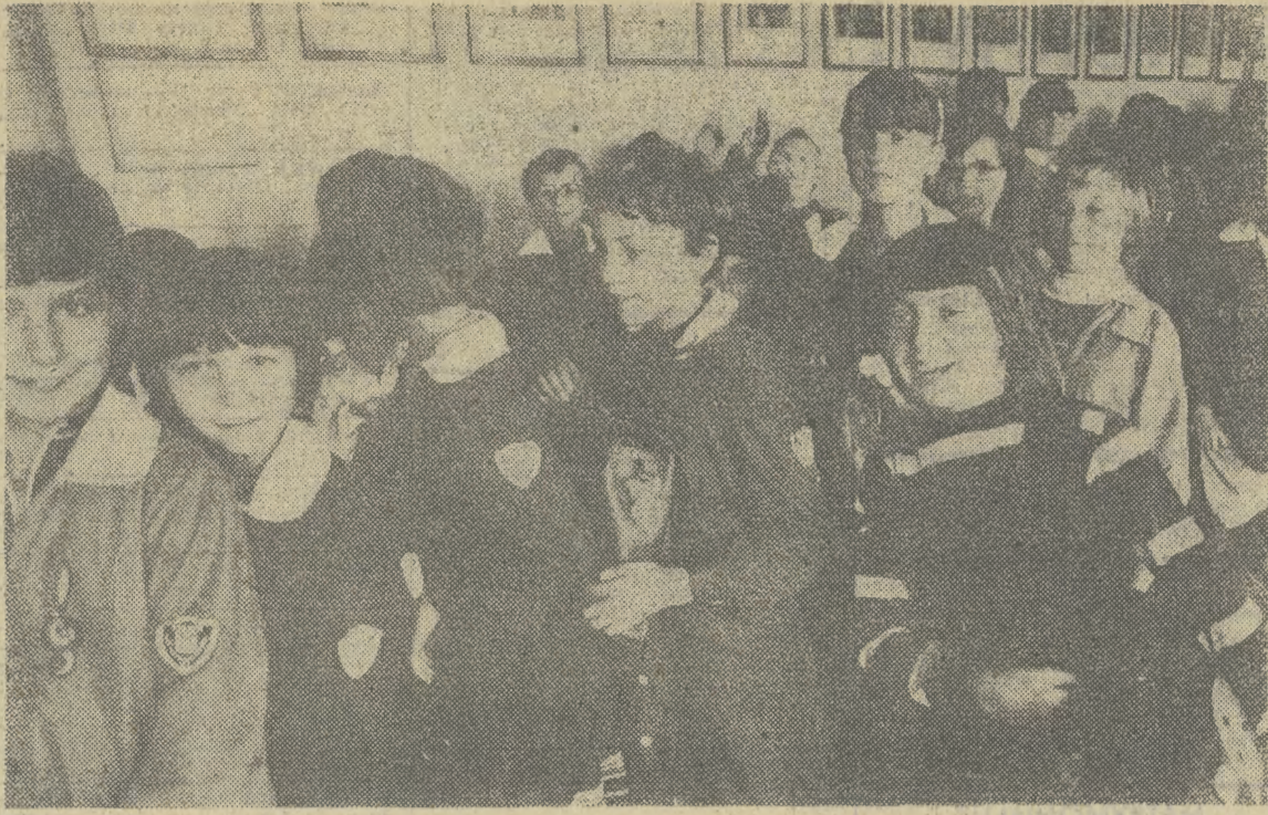
Fot.: JADWIGA RUBIŚ