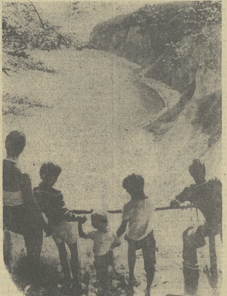
Wyspa Rugia jest jednym z najpiękniejszych nadbałtyckich zakątków NRD obecnie odwiedzanych przez turystów.

Andrzej Szymański: „Z drugiej strony lustra”, cena 80 zł. Uduany debiut dobrze zapowiadającego się młodego pisarza warszawskiego, iamiący świadomości wszelkie powieściowe konwencje zmierzający do intelektualnej refleksji i poetyckiej metafory, poświęcony jest problemowi rewolucji, ukazany na przykładzie Wielkiej Rewolucji Francuskiej. Ale temat ten jest tylko pretekstem do porównań ogólniejszej natury nad sposobami społecznych zmian.