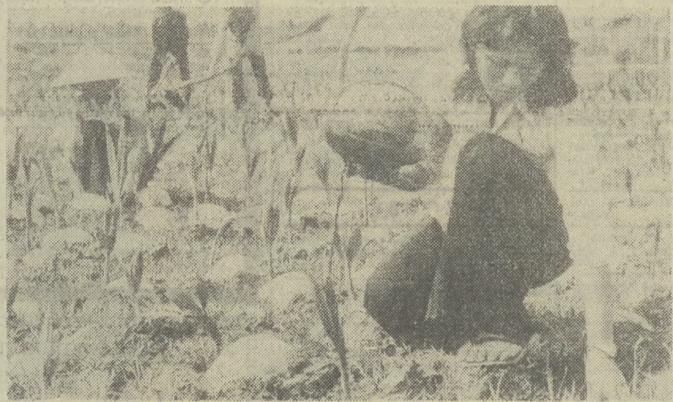
W delcie rzeki Mekong, w południowej części Wietnamu, znajdują się plantacje orzechów kokosowych, z których co roku zbiera się 100 milionów sztuk tych cennych owoców.

Wśród różnych chińskich symboli długowieczności — najbardziej popularnym symbolem jest brzoskwinia. A oto co głosi o niej oryginalna legenda: „Dawno, dawno temu, za dziewiątym niebem, w Krainie Nieśmiertelnych, gdzie szczytu Pamiru, i Kuentunu dotykają niebios, żyła Si Wang Mu — Matka Królowa Zachodu. Raz na trzy tysiące lat, gdy owocowała w jej ogrodzie drzewo brzoskwinia, urządziła wielką ucztę. Podejmowała gości brzoskwiniami i innymi owocami niebiańskimi. Zjedzenie „boskiego owocu” zapewniło nieśmiertelność”. Chociaż obecnie w Chinach mało kto wierzy w te legendy to jednak prawie każdej uroczystości urządzanej z okazji jakiegokolwiek rocznicy towarzyszy położona na stole brzoskwinia, symbol szczęścia i długowieczności. (TG)