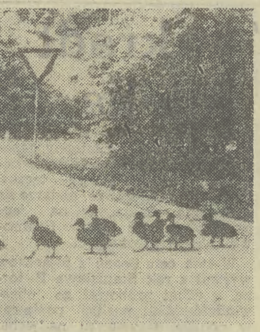
Pierwsza lekcja przechodzenia przez jezdnię.

BONN (PAP). Zachodniemiecka partia obrońców środowiska — „Zieloni”, wniosła we wtorek do Bundestagu projekt ustawy domagającej się zamknięcia w okresie 6 miesięcy wszystkich silowni jądrowych w kraju. Ich zdaniem, silownie te są wielkim zagrożeniem dla środowiska i zdrowia ludności, nawet jeśli reaktory atomowe pracują bezawaryjnie. Energia produkowana w silowniach jądrowych jest ponadto dużo droższa niż zakładano.