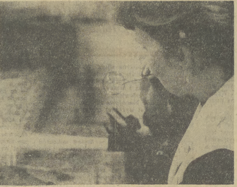
Zręczne ręce dmuchaczki obracają w płomieniu palnika gazowego szklaną rurę, z której podobnie jak mydlana bańka powstaje przezroczysta kula.

A POZA TYM: * Pałac Młodzieży, ul. Krowderska 8 — zaprasza chętnych do pracy w teatrze poezji, do wzięcia udziału w turnieju recytatorskim pt. „Upokorzeni ziemią czyli sztuka obecności”. Zgłoszenia utworów przeznaczonych do wykonania (wiersz, proza, piosenka lub pantomima) przyjmuje i bliższych informacji udziela punkt konsultacyjny w turnieju w poniedziałki i piątki od godz. 18.30 do 20.30 — w Pałacu Młodzieży. Turniej odbędzie się w styczniu 1984 r.