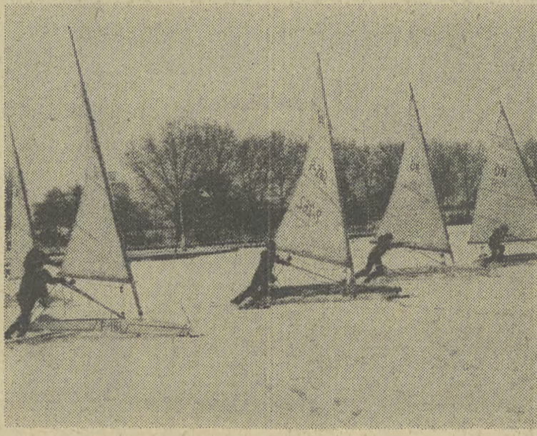
Na jeziorach woj. olsztyńskiego już trenują bojerowcy.

będą mogły być eksploatowane do swej śmierci technicznej.