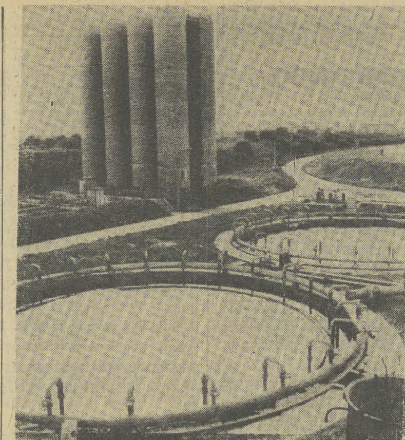
Oczyszczalnia w zakładach chemicznych w miejscowości Leuna (okręg Halle, NRD).

A.N.: Z pewnością jest nią obowiązek rejestrowania przyczep lekkich do 750 kg, np. campinowych, z wyjątkiem przyczep motocyklowych. Teraz każda taka przyczepa będzie posiadała