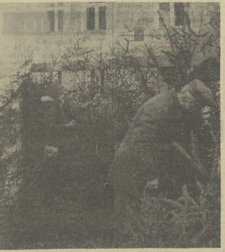
W każdej z dzielnic Krakowa trwa sprzedaż świątecznych choinek. Patrząc jednak na to, co oferuje się pod nazwą „drzewko“ za wygórowane w tym roku ceny, zaczynamy poważnie myśleć o sprężeniu sobie zgrabnej, sztucznej choinki.