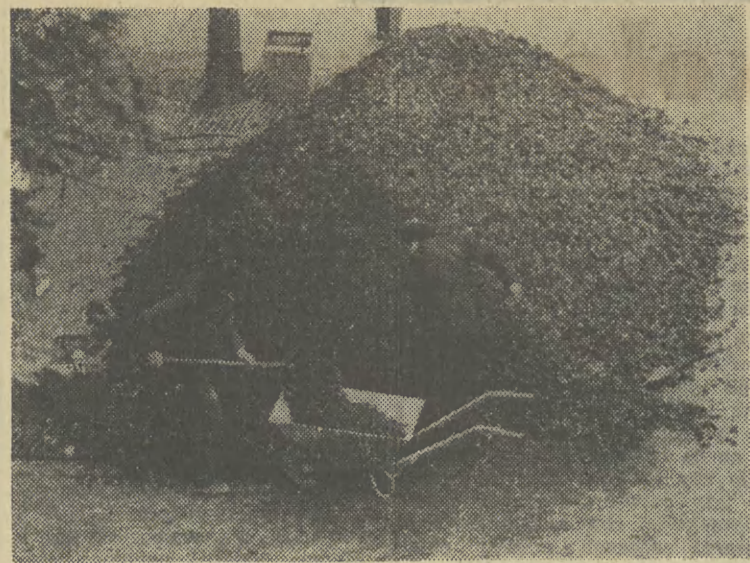
Na całe szczęście, tego roku nie brakuje opału...

— Pracowaliśmy w ostatnią sobotę i niedzielę, mamy wydłużony dzień pracy, a wszystko po to, by przygotować dla 71 krakowskich sklepów PSS „Spotem“ i ponad 40 agencyjnych wystarczającą ilość stódek wyrobów. Jesteśmy przygotowani na pełne zaspokojenie wszystkich zamówień handlu. Nie boimy się konkurencji ze strony prywatnych cukierni, głównie ze względu na dobrą jakość naszych wyrobów, jak również konkurencyjne ceny (mniej więcej takie same jak w roku ubiegłym). Co prawda, nie mamy migdałów, fig i daktyli, ale nie brakuje rodzynków, orzechów, maku oraz polewy czekoladowo-kakaowej. Do piątku przekazemy do sklepów 45 ton wypieków, a przed sylwestrem, jeśli będzie zapotrzebowanie, to możemy dostarczyć około 20 tys. sztuk pączków dziennie. (ev)