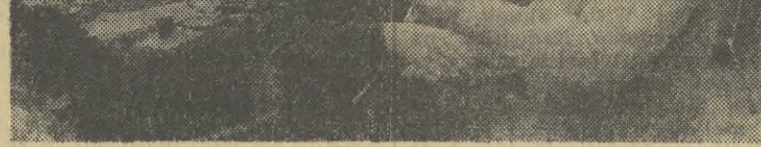
W Krakowskich Zakładach Armatury odbyło się spotkanie członków Klubu Honorowych Dawców

— wiedzą jak był montowany taki kaloryfer, więc „cholera wie co mogło walnąć”