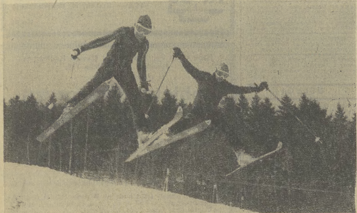
Do takich zaław na nartach potrzebne jest dobre opanowanie tańników tego przyjemnego, zimowego sportu.

Sprawę tę reguluje układ zbiorowy i podpisana umowa o pracę, w której ma Pani wyszczególniony zakres obowiązków. Jeżeli są to okna małe, wchodzą w zakres sprzątnięcia, duże i na wysokości mycie są z reguły na umowę-zlecenie. Jeżeli natomiast sprawa dotyczy sprzątnięcia po malowaniu, regulowane jest odrębną zapłatą. (dag)