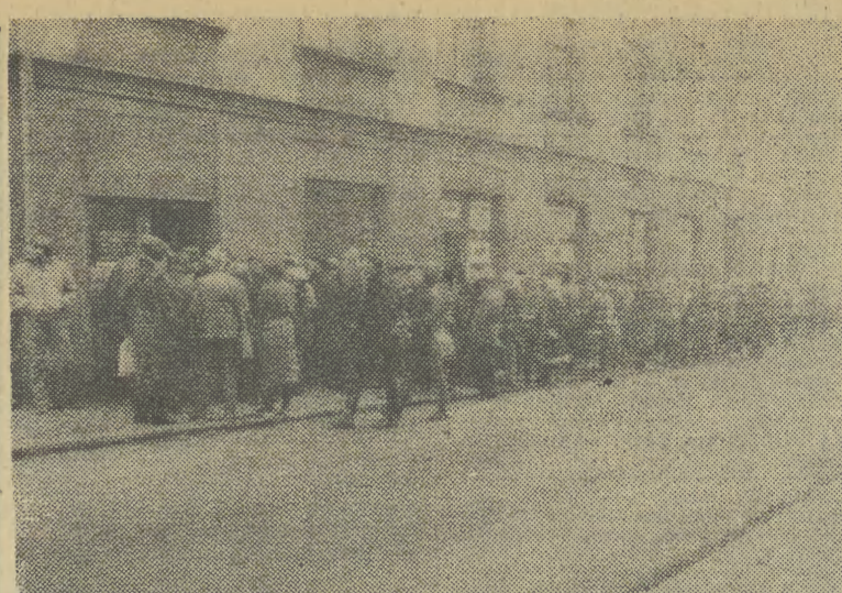
A podobno „Filmowe konfrontacje” są nudne...

W lipcu wydano właścicielom działek decyzje o wywłaszczeniu, a po trzykrotnych odwołaniach — chodzilo głównie o to, czy zabrane będą całe działki czy tylko części zajęte bezpośrednio pod zabudowę — zakończono sprawę wyplatując odszkodowania po obowiązuje cenie (z reguły 208 zł za metr). Tak więc obtrzymali gmach postawiono na cudzej ziemi. Rzecz to bez precedensu. I choć jesteśmy spokojni, że stara zasada „czyj grunt, tego budynek na nim stojący”, nie znalazłaby tu zastosowania, to ciekawi jesteśmy jak duży metlik powstałby, gdyby za regulowanie spraw gruntu zabrano się po wykończeniu budynku. (ag)