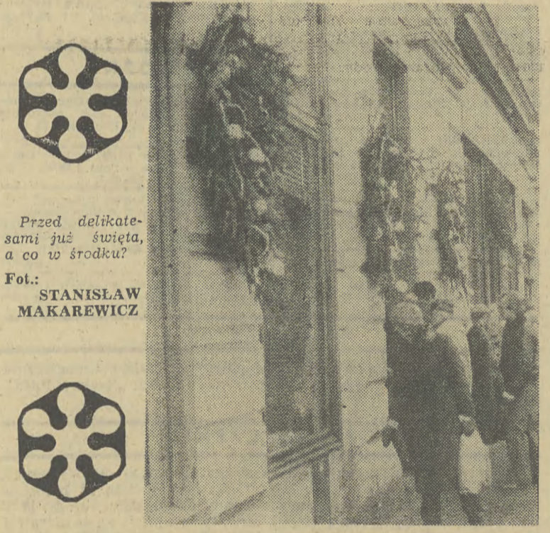
Przed delikatami już święta, a co w środku?

niezadowolonego klienta i właściciela prywatnej firmy. Cenowe wątpliwości okazały się słuszne. Komisja cechowa po porównaniu wystawionego przez rzemieślnika rachunku z obowiązującym cennikiem stwierdziła, że figurująca na kwicie kwota została zawyżona o 1620 zł. Rzemieślnik sumie też zwrócił, dodał jeszcze tysiąc złotych jako rekompensatę za uszczerbek, którego w jego warsztacie doznał „fiat” i, co najważniejsze, przeprosił za swą niesolidność, zobowiązując do poprawy. Cechowi Rzemiosł Motoryzacyjnych należą się słowa uznania za szybkość i zdecydowane działania. (ar)