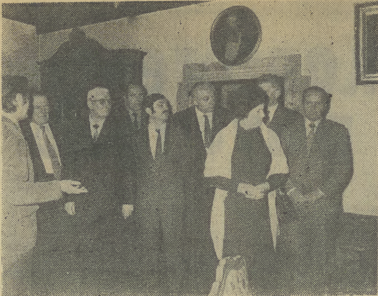
Na zdjęciu: radziecy goście w Collegium Maius.

W STOLICY Belgii zakończyły się w niedzielę obrady sesji Międzynarodowego Komitetu