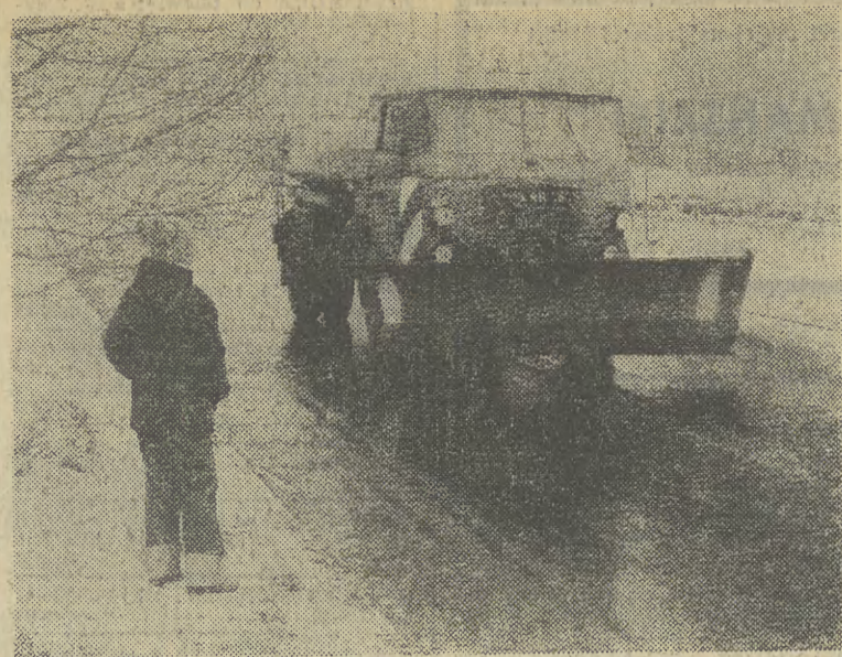
W poszukiwaniu zaśmieconych ulic...