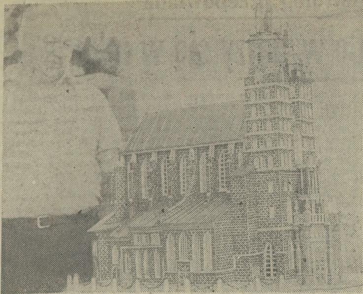
Sposób na pogodę ducha