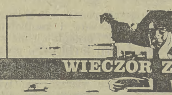
WIECZOR Z KSIĄŻKĄ

fatalnego w konsekwencjach moralnych wydarzenia ze swą żoną, która za cichą zgodą męża uległa dziedzicowi, w zaciętego wroga pana, czyniącego i myślącego jemu na przekór. Kompleksem bohatera jest właśnie owa fascynacja panem, który nie tylko zgwałcił jego żonę, ale zgwałcił również jego umysł, nie zdolną jednak do końca posiadać jego duszy. Ubogi sluga uległ