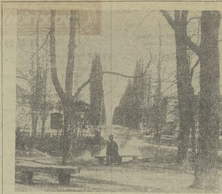
To nie są jakieś odległe peryferie, lecz centrum Krakowa w... 1866 r. Zdjęcie to wykonano z narożnika Planu (Basztowa — Westerplatte) i przedstawia widok w głąb ul. Lubica. Te piękne strzeliste drzewa (na drugim planie), to natomiast topole wytyczające wówczas tzw. Gościniec Mogiński. Dziś stanowi on główną arterię komunikacyjną do Nowej Huty, co sprawiło, że zieleni jest tu skąpa i trudno ją utrzymać oraz zabezpieczyć przed niszczącymi działaniami spalin samochodowych.