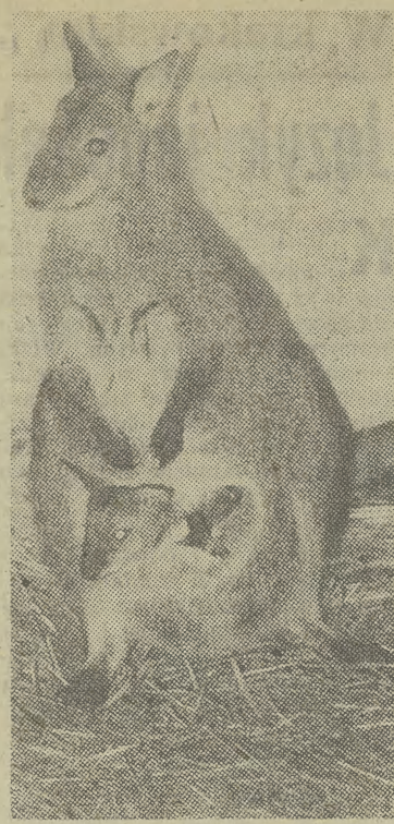
Nie ma to, jak własne M-1...