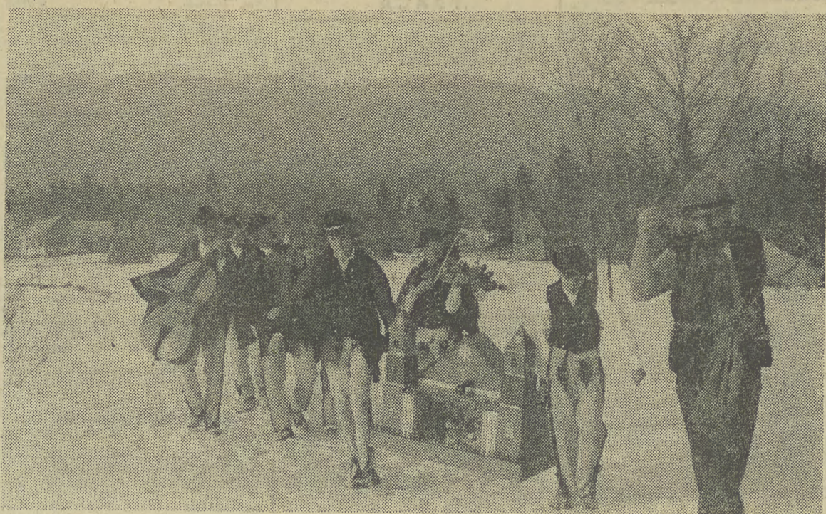
Kołodnicy na Orawie.