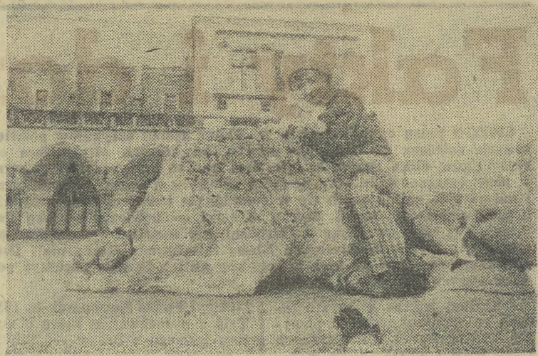
Póki nie ma śniegu, zamiast na sankach jeździmy na lwie.

Przed rozpoczęciem sesji, o godzinie 9 w sali Dietla odbędzie się posiedzenie zespołu radnych Rady Narodowej m. Krakowa - bezpartyjnych.