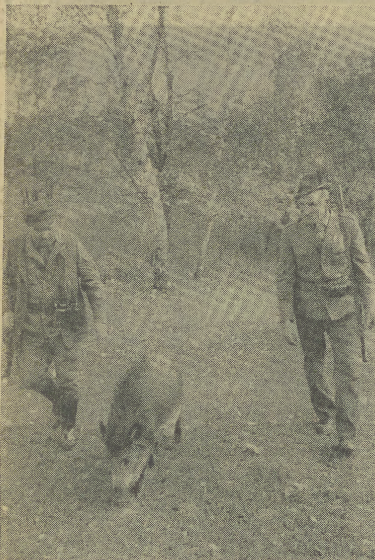
Czyżby dzik był przewodnikiem?