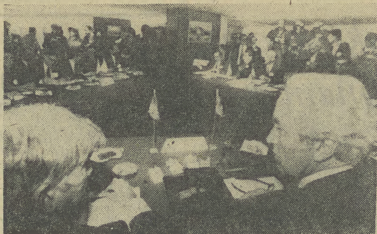
W podbejruckiej miejscowości Chalde rozpoczęły się we wtorek rokowania izraelsko-libańskie z udziałem delegacji USA w sprawie wycofania z terytorium Libanu izraelskich sił okupacyjnych. Rozmowy będą kontynuowane jutro. Rzecznicy delegacji amerykańskiej, izraelskiej i libańskiej określili pierwsze spotkanie jako pomyślne, odnotowując pewien postęp.