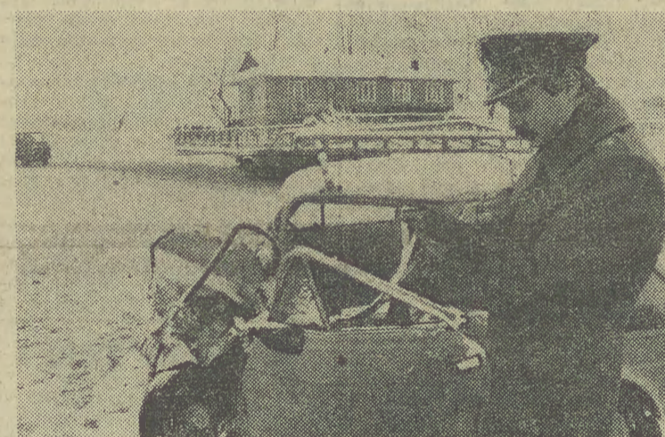
Mimo trudnych warunków jazdy, jakie wystąpiły na drogach wraz z pierwszymi opadami śniegu i występującą lokalną goleńdzą na południu kraju, sporo kierowców nie zachowało należytej ostrożności. Na zdjęciu: tak wygląda „fiat 126p” po zderzeniu w Zakopanem.

ki był głos Rady Społeczno-Gospodarczej przy Sejmie PRL), instytucje naukowe PAN, organizacje społeczne i zawodowe (Krajowa Rada Kobiet Polskich, NOT, Polskie Towarzystwo Ekonomiczne). Wreszcie nie zabrakło głosu zakładów pracy i indywidualnych obywateli. (Dokończenie na str. 2)