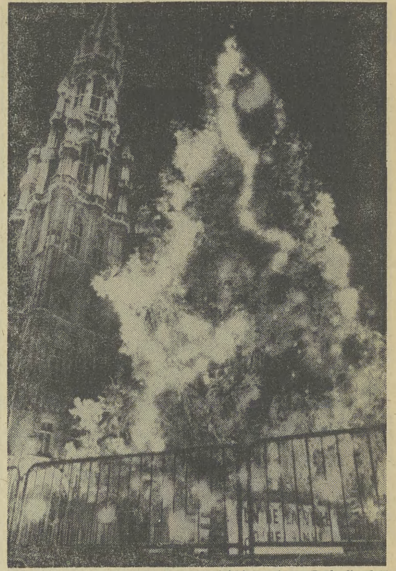
Zgodnie ze świąteczną tradycją staromiejski rynek w Brukseli zdobi choinka, przysłana w darze z Finlandii.

Największa baszta Minska przekazana została muzeum historii kinematografii białoruskiej, w którym urządzono ekspozycję poświęconą wkładowi tej kinematografii i studia „Białarusfilm” w rozwój radzieckiego kina. Na Białorusi co roku produkuje się ok. 100 filmów fabularnonaukowych, popularnonaukowych.