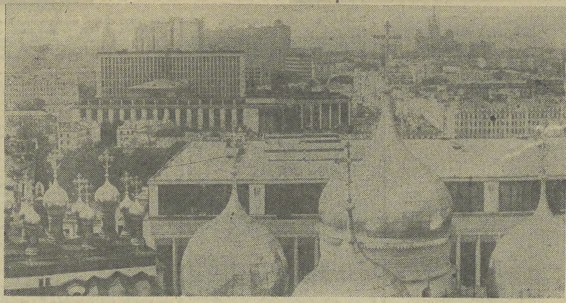
Panorama centrum Moskwy.