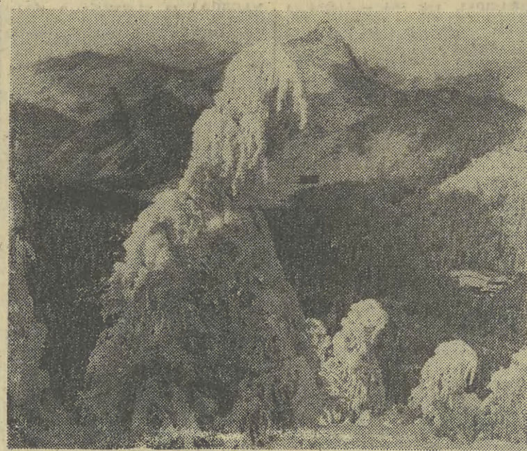
Widok na Kalatówki z Bocznia.