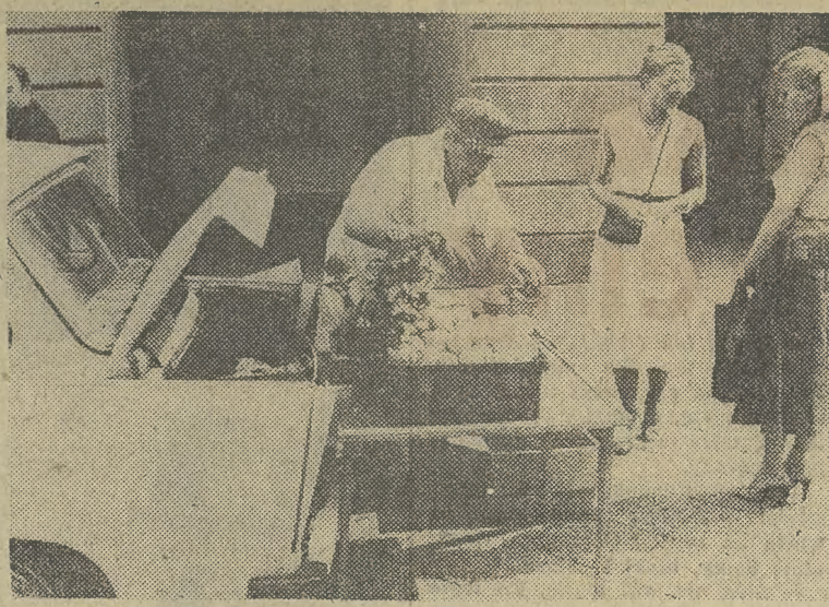
Owoce w tym roku obrodziły. Wielu kupujących, z racji wysokich cen panujących na targowiskach ogranicza się jednak do minimalnych zakupów. Popularnością cieszy się jednak sprzedaż owoców wprost od producentów czy działkowców, po cenach niższych niż te „oficjalne”. CAF — FRELEK

Po mszy prymas Polski odmówił z duchowieństwem i wiernymi modlitwę w intencji Ojczyzny. (PAP)