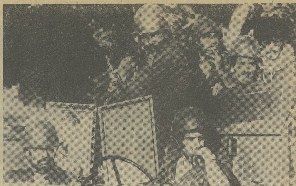
Evakuacja żołnierzy palestyńskich i syryjskich z Bejrutu dobiega końca. Do poniedziałku miasto opuściło drogą morską i lądową (samochodami — na zdjęciu) 13.700 Palestyńczyków i Syryjczyków. Wczoraj Bejrut opuścił także przewodniczący Komitetu Wykonawczego OWP — Jaser Arafat. Statek, którym Arafat udał się do Grecji był eksportowany przez dwie jednostki francuskiej marynarki wojennej.

— Nie mam jeszcze fartuska i juniorek. Brak mi też „prasteliny”. (Dokończenie na str. 2)