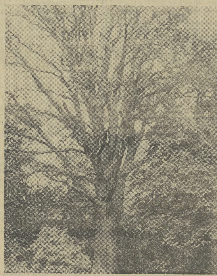
Dąb Stanisława Wyspiańskiego w korabnickim parku.