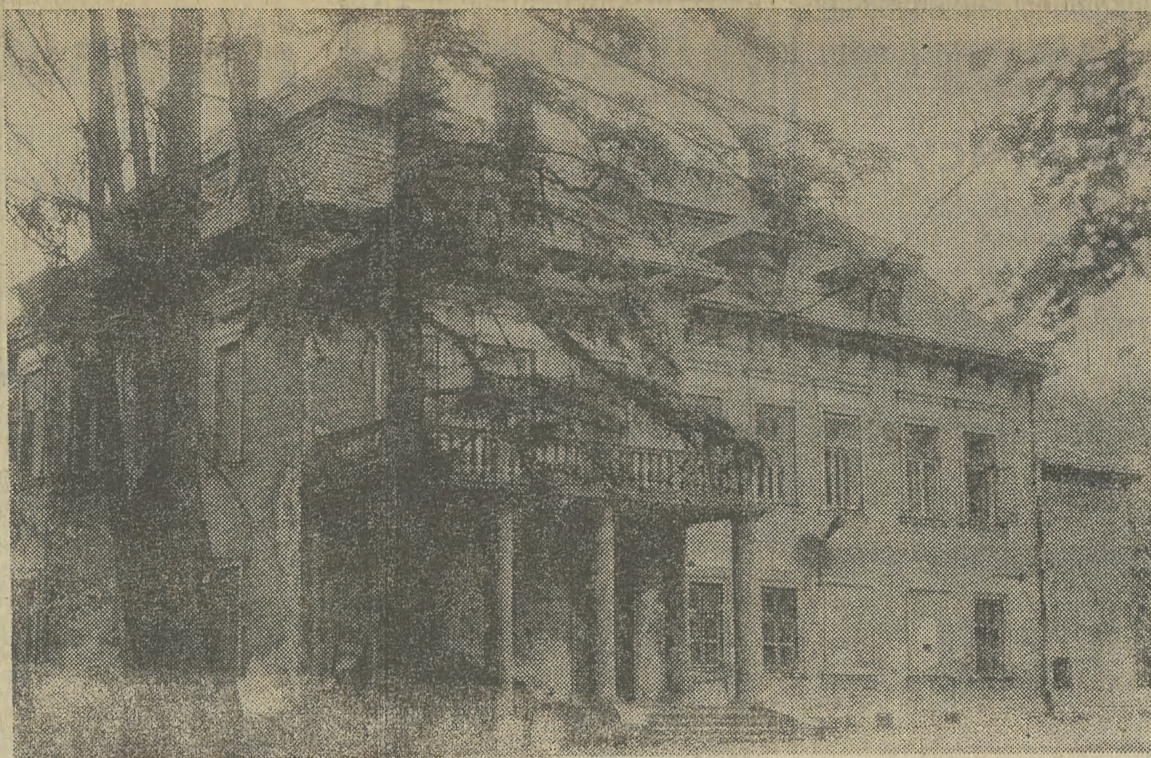
Fasada XIX-wiecznego pałacu w Korabnikach.