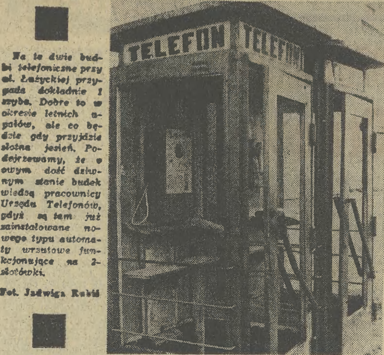
Na te dwie budki telefoniczne przy ul. Łazyckiej przystąpiła do budowy...