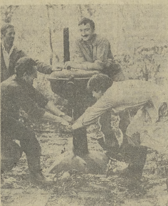
Gdy poziom rzeki wzrośnie, zasuwę trzeba zamknąć.