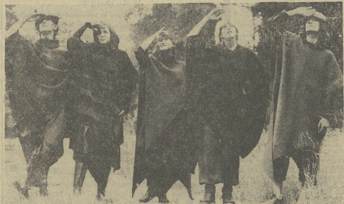
Z myślą o spacerach w chłodne dni jesienne — modele pomysłu uczniów wiedeńskiej szkoły projektantów mody „Hetendorf”.

Byłem przez parę ładnych lat kierownikiem sklepu spożywczego, ale takiego oszukiwania klientów za czasów mojej pracy zawodowej nie widziałem. Nie mógłbym się pogodzić z takim postępowaniem u siebie i w swoim najbliższym otoczeniu. Obecnie, przebywając już na rencie II grupy, zapytałem jak długo można tolerować opisane i im podobne nieprawości? (Nazwisko i adres zastrzeżone do wiadomości redakcji)