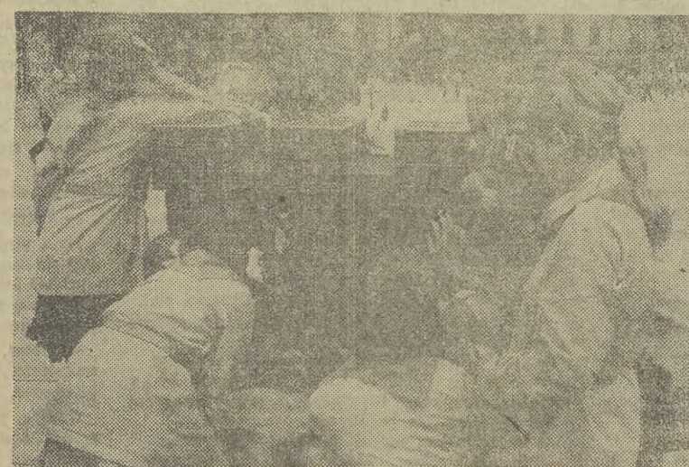
Wrzucić nie wrzucić, obejrzeć można.

No cóż, tylko życzyć projektantom by zawsze planowali jakieś ważne urządzenia w budynkach szkół, przedszkoli, sklepów... (ag)