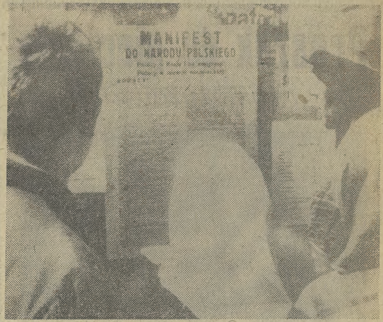
Ten dokument był przed 38 laty czytany powszechnie, przez wszystkich; wszedł on na stałe do historii naszego kraju. 21 lipca 1944 roku, z inicjatywy PPR, Krajowa Rada Narodowa wydała dekret o powołaniu Polskiego Komitetu Wyzwolenia Narodowego. 22 lipca ogłoszony został historyczny Manifest PKWN.