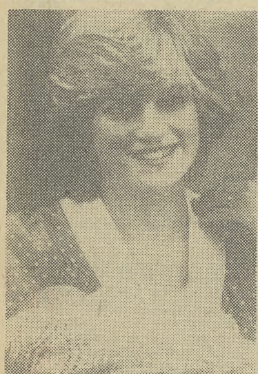
Księżna Wali Diana bardzo troskliwie opiekuje się osobiście swym nowo narodzonym synkiem, następcą następcy tronu.

Wycieczka pn. „ROMANTYCZNY ZAKĄTEK JURAJSKI” — przejazd pociągiem do Rudawy — (Dokończenie na str. 2)