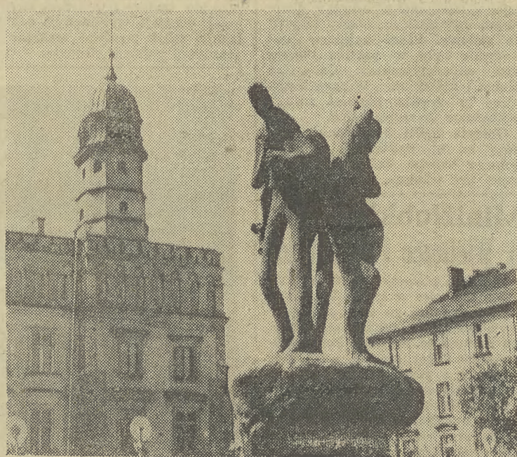
„Grajkowie” — rzeźba Bronisława Chroмого na pl. Wolnica.