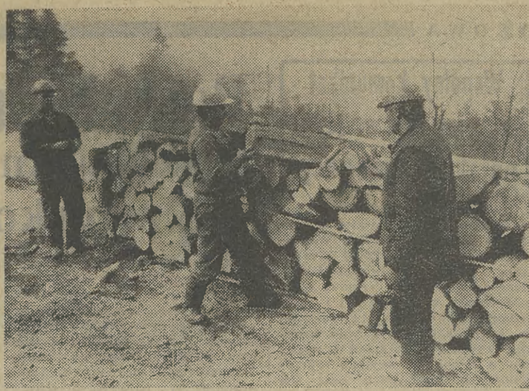
CAF — Moroz

J UTRO pogoda w rejonie Krakowa kształtować się będzie w zasięgu wiatu. Zachmurzenie duże z większymi przejaśnieniami. Rano zamglenia. Wiatr płn. i płn.-wsch. 3-5 m/sk. Temp. maks. dniem 6-9, min. nocą 5-2 st. C. Rano wilgotność powietrza 92 proc. (W)