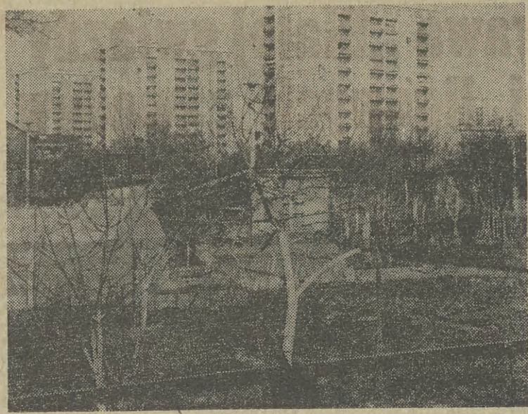
W ogródkach działkowych sygnalizują wiosnę świeżo bielone drzewka owocowe...