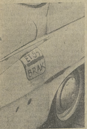
Tak oto przed ewentualną kradzieżą asekuruje się właściciel remontowanego samochodu: na wlewie paliwa namalował widoczne „ET-94 brak.” Sprawa jest jasna...

Teatrzyk jest w pełni samodzielny, ociemniałe dzieci same sobie akompaniują, tańczą, śpiewają a nawet pomagają przy wykonywaniu strojów dla lalek. Wszystkiego jednak nie potrafia zrobić. Konieczna jest pomoc. Przydałoby się trochę nowych rekwizytów, sprzętów. Może i tym razem w sukces pospieszy Teatr „Grotteska”? A może Wydział Kultury Urzędu m. Krakowa zasili finansowo kasę teatrzyku?