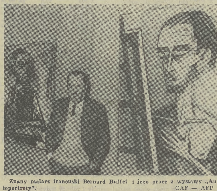
Znany malarz francuski Bernard Buffet i jego prace z wystawy „Autoportrety”.

Dziś o trzech płytach mających wspólny mianownik — choć różnych tak koncepcją, jak i poziomem. Płyty nie są najnowsze, jednak wielu słuchaczy wciąż ich poszukuje. Można więc mieć nadzieję, że wydawcy wkrótce zmultiplikują nakłady tych krążków. Wszak samofinansującemu się przedsiębiorstwu powinny przydać się pieniądze, jakie gotowi za jego produkt zapłacić klienci.