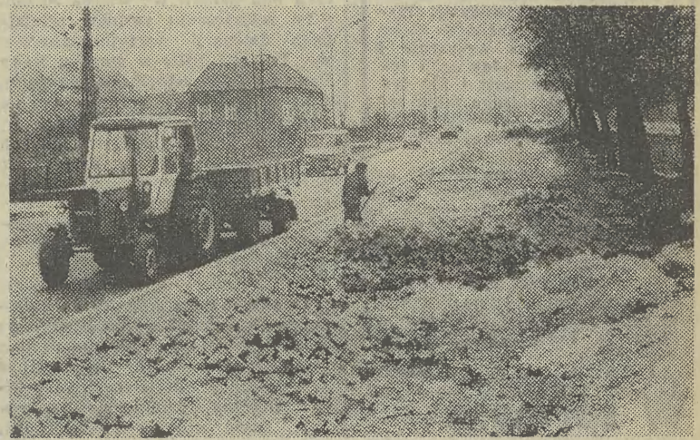
Wykonawcom pozostały jeszcze prace przy porządkowaniu wysepek.

Zróżna watykańskie nie podały szczegółów rozmowy, określając ją jako prywatną.