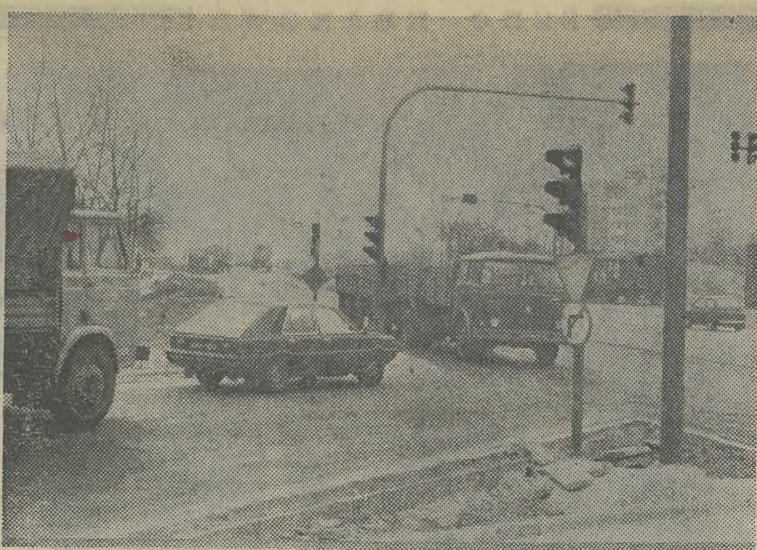
Na skrzyżowaniu ul. ul. Wielickiej i Kamińskiego już nie tworzą się gigantyczne korki.

W PONIEDZIAŁEK w Brukseli rozpoczęły się dwudniowe obrady wspólnorządowe „szczytu”, w którym biorą udział szefowie państw i rządów dziesięciu krajów członkowskich EWG. We wczesnych godzinach popołudniowych w brukselskim pałacu Akademii Królewskich odbyła się ceremonia jubileuszowa z okazji 25. rocznicy EWG.