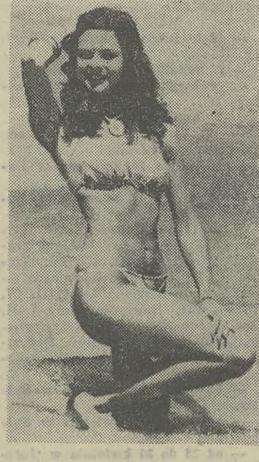
Tak, to oczywiście Australijka i plaża w Melbourne. Ale nie martwmy się, lato i do nas zawita.

W 1912 r. zmarł Karol May (ur. w 1842 r.), niemiecki pisarz; w latach 1865-74 za liczne kradzieże, fałszerstwa i oszustwa, przebywał w więzieniach, gdzie „uciekł” w świat fantazji, przygotowując notatki większości swych powieści z Dzielnego Zachodu (który zobaczył po raz pierwszy u schyłku życia, mając lat 60); autor czytanych do dziś powieści: „Winnetou”, „Skarb w Srebrnym Jeziorze” czy „Old Surehand”. (w.g.)