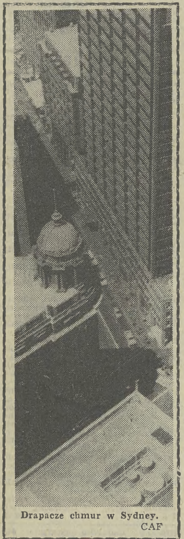
Drapacze chmur w Sydney.

OD 1 STYCZNIA 1982 „Biprostal” jest instytucją samofinansującą się. Wcześniej już musiano pomyśleć więc o „zorganizowaniu” sobie zamówień, co nie było znów takie łatwe. Pomogła jednak tradycja fir-