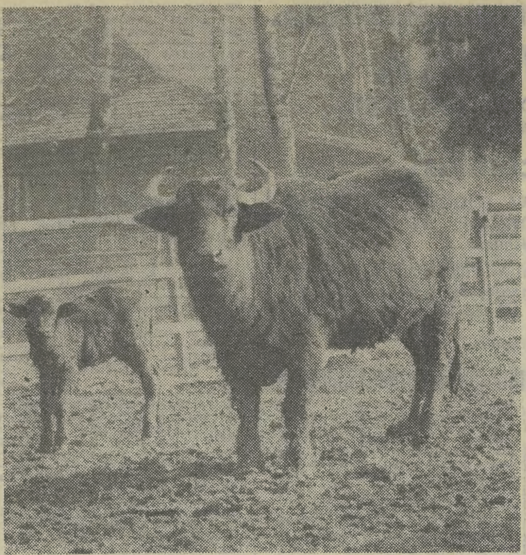
Spacer po krakowskim Zoo: bawoły najbardziej lubią wędrówki, szczególnie w promieniach wiosennego słońca.