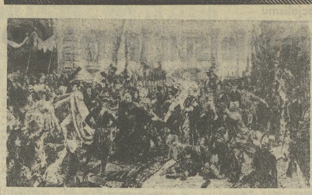
Reprodukcja obrazu J. Matejki pt. Konstytucja 3 Maja.