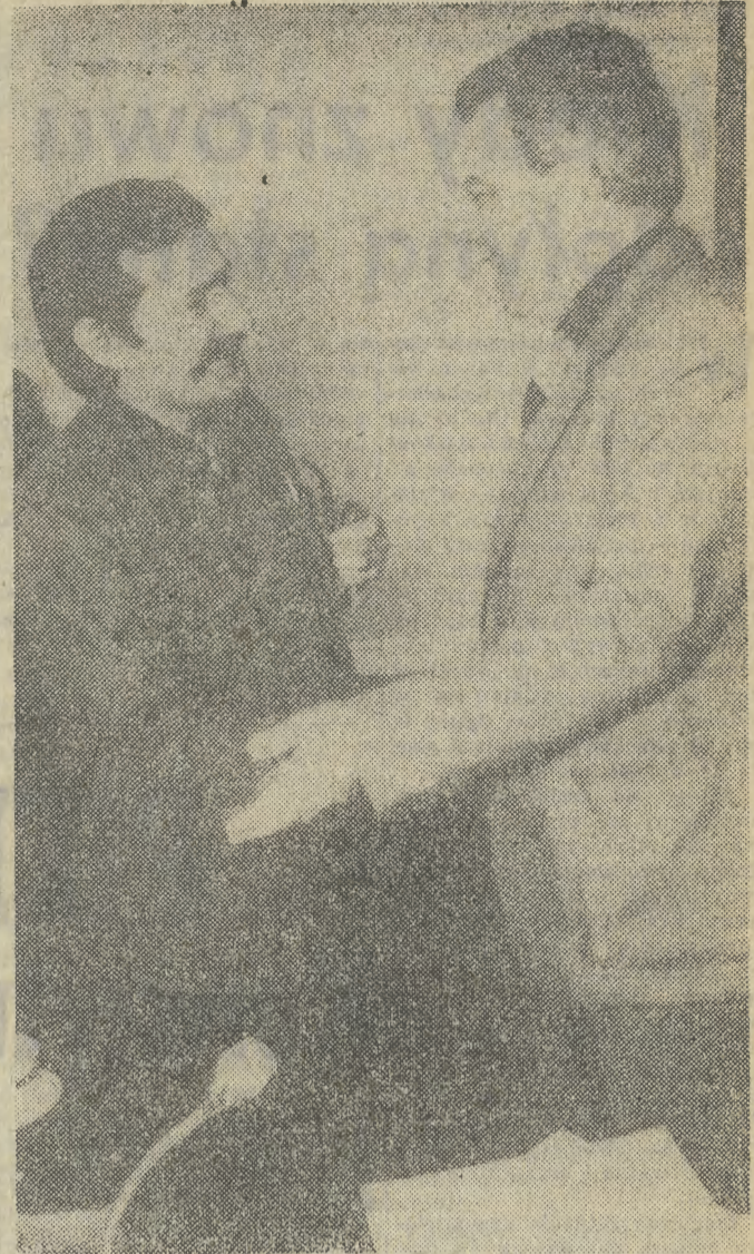
Przewodniczący KKP NSZZ „Solidarność” — Lech Wałęsa w rozmowie z przewodniczącym Komisji Porozumiewawczej Branżowych Związków Zawodowych — Albinem Szyszką.