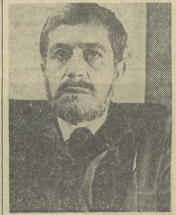
Dzisiaj kino „Wanda” rozpoczyna projekcję polskiego filmu „W BIAŁY DZIEŃ”, w reż. Edwarda Żebrowskiego...

W związku z tymi trudnościami zaopatrzeniowymi trzeba się poważnie zastanowić jak usprawnić dystrybucję tego, co mamy do podziału, bo z początkiem maja zaczynają obowiązywać w skali ogólnokrajowej dalsze kartki na niektóre inne produkty spożywcze.