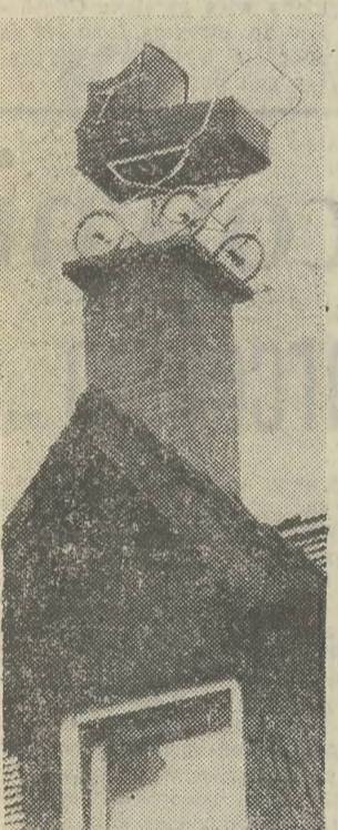
Ułatwienie dla bociana?

— Mamy nadzieję, że rozpocznie się ona już wkrótce.