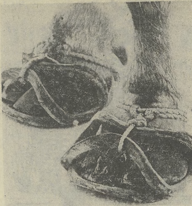
FILIPINY. Takie gumowe „sandalki” chronią kopyta bawołu na twardej nawierzchni drogi, po której musi ciągnąć wóz swego pana.