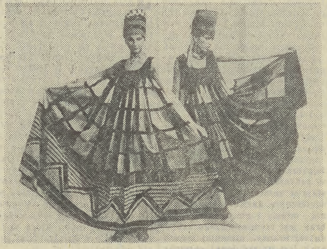
Słynna ze swej urody królowa starożytnego Egiptu Nefretete stała się natchnieniem dla francuskiego projektanta mody — Louisa Ferauda. Oto dwie suknie wieczorowe z jego kolekcji, zaprezentowane niedawno w Monachium.

pedów wydzielają delikatny zapach goździków. Ten relikwowy gatunek przetrwał na nielicznych stanowiskach leśnych, głównie w okolicach Sandomierza i Roztocza, Łatwiej, choć też nieczęsto, natknąć się można w mieszanym lasach z domieszką buków, a w górach na skrajach gąszczy Kosodrzewiny na jego krewniaka — wawrzynek wilczczyko. Tworzy on nieco wyższe krzewy, a kwiaty ma jaśniejsze, choć równie silnie pachnące. Wawrzyński są piękne, ale pamiętać należy, że oprócz prawnej ochrony, którą są objęte, mają też własną i to bardzo skuteczną broń. Są to rośliny silnie trujące. Podziwiać je lepiej z daleka, ale podziwiać warto. (hs)