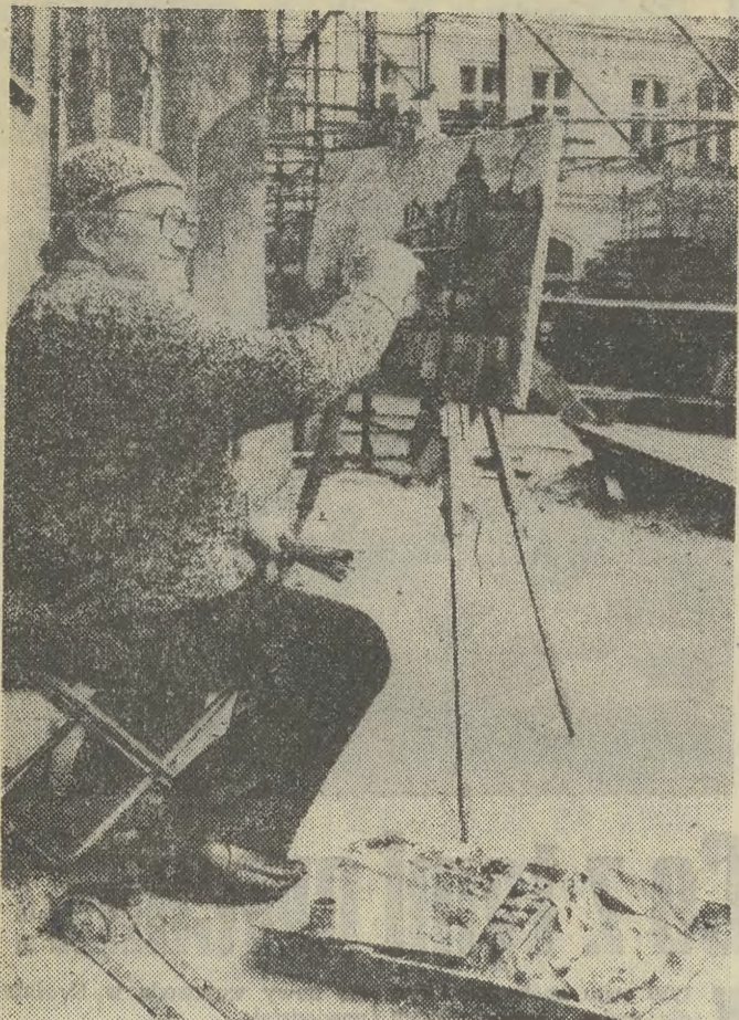
Kraków — zawsze wdzięczny temat dla malarza.