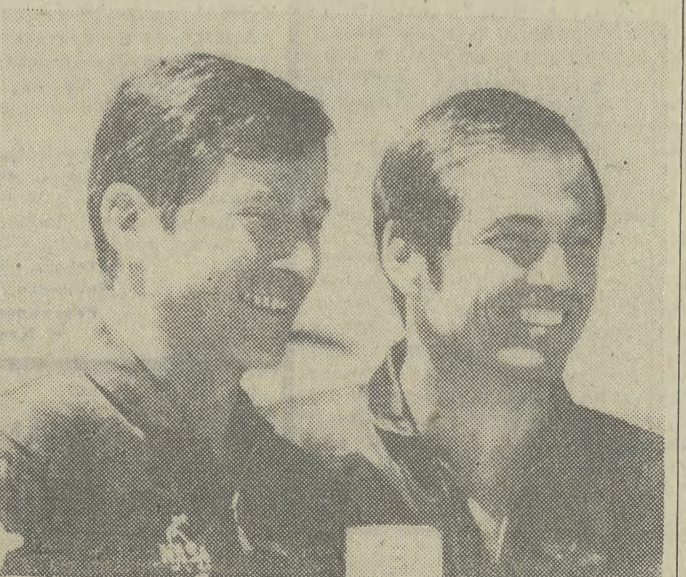
Oto dwaj główni bohaterowie pierwszego lotu promu kosmicznego „Columbia” — John Young (z lewej) i Bob Crippen po wylądowaniu w bazie lotniczej Edwardsa w Kalifornii. „Columbia” we wrześniu br. odbędzie kolejny lot, którego załogę stanowić będą 49-letni płk Joe H. Engle i 41-letni kpt. Richard H. Truitt.

Kantoniński dziennik „Jang Czenng Wanbao” informuje, że nad prowincją Kuangtung przeszła burza gradowa o rozmiarach kataklizmu. Z informacji gazety wynika, że niektóre gradziny osiągnęły wagę 15 kilogramów. Burza wywołała katastrofalne skutki. Zanimowano 5 ofiar śmiertelnych, 225 osób odniosło rany, 10500 domów uległo zniszczeniu. Grad zniszczył kanały irygacyjne, przerwał komunikację, w tym także telefoniczną i pozbawił 15 osiedli prądu elektrycznego. (PAP)