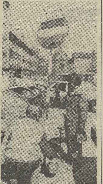
Postój dorożek konnych także wymaga wiosennej kosmetyki.

Wiadomości: 16.40, 22.55. 16.45 Kwadrans akadem. (Kr). 17.00 Dni Muz. Organowej — rep. (STEREO) (Kr). 17.20 Z płytoteki Z. Gogulskiego (STEREO) (Kr). 17.55 Gospodarskie rozm. (Kr). 18.14 Muz. rozr. (Kr). 18.25 Postawy i wzory. 18.40 Nauka i Techn. 19.00 Rad. Poradnik Jęz. 19.15 Lekc. jęz. ros. 19.30 Dzieła B. Bartoka (STEREO). 20.10 Muz. na Wielki Tydzień (STEREO). 20.40 Muz. O. Messiaena (STEREO). 21.40 Muz. 22.15 Wersje kontrowersje.