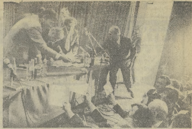
Po spotkaniu w WSK uczestnicy tłumnie ustawili się po autografy wicepremiera M. F. Rakowskiego, które zbierano na specjalnie wydrukowanych kartkach wstępu.