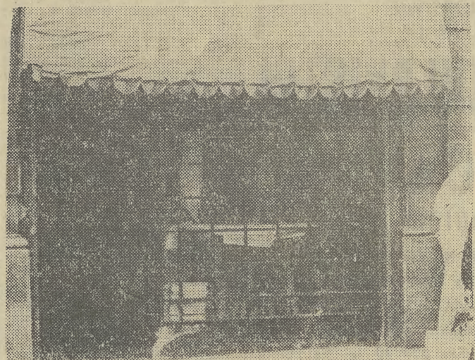
...nie da się wypić kawy...

Dyżury pogotowia zyczliwości odbywać się będą w każdą środę w godz. 16-20 w Zarządzie Wojewódzkim PCK ul. Świerczewskiego 19, Wydział Organizacyjny, tel. 291-15. (ms)