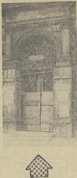
Za nie wypłacone pieniądze w remontowanym w Ryńku Głównym banku...

Sprawdziliśmy u źródeł. Dyr. Cz. Tochowicz powiedział, że takiej decyzji nie wydał, że sklepy nadal powinny przyjmować przedpłaty w dotychczasowej wielkości. (ms)