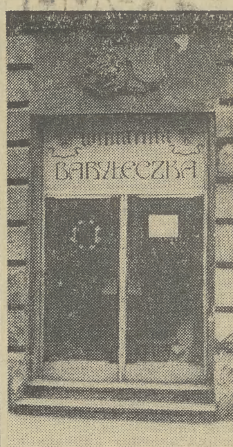
...ani nawet pocieszyć lampką winą!

* W Salonie Wystawowym TPSP al. Róż 3 — otwarta została dzisiaj wystawa malarstwa Ryszarda Golińskiego.