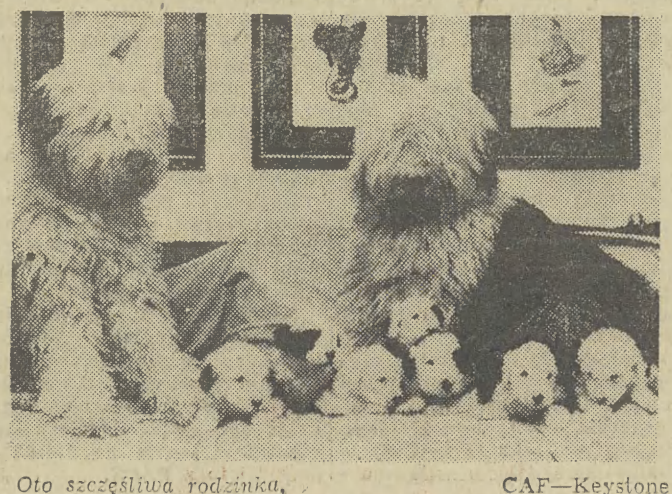
Oto szczęśliwa rodzinka.

NIEZNANI osobnicy obrzucili kamieniami wityrnyw biura radzieckiego „Aeroflotu” w Berlinie Zachodnim.