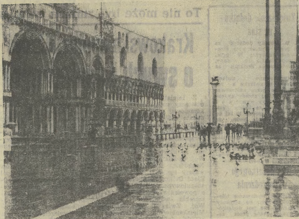
WENECCJA, Plac św. Marka z fragmentem Bazyliki oraz Piazzetta z fragmentem Pałacu Dożów i widokiem na San Giorgio Maggiore.