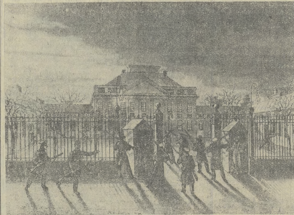
Sygnalem do rozpoczęcia Powstania był atak na Belweder podchorążych pod wodzą Piotra Wysockiego.