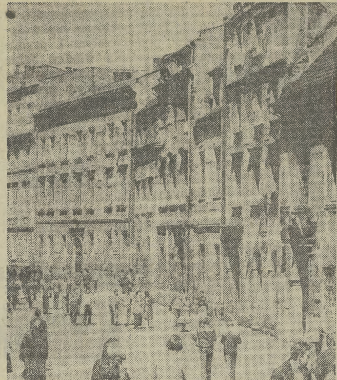
Zywa ulica Kanonicza — czy tylko nie spełnione marzenie?