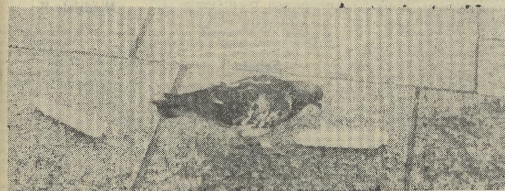
Gotąb z krakowskiego Rynku kaczanem ku kurydzy też nie gardzi...

W niedzielę, 30 bm. w godzinach 13.30—15 i 16.30—17.30 w związku z przemarszem delegacji „Solidarności” z zakładów pracy na trasie: al. Lenina, Przyjaźni, Rewolucji Październikowej, Marksa oraz powrót: Majakowskiego, Marksa, Engelsa do osiedla Handlowego nastąpi ograniczenie w ruchu. Komunikacja autobusowa MPK na liniach: 110, 122, 123, 136 i 153 odbywać się będzie trasami zastępczymi.