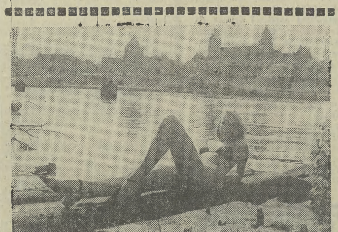
Najlepszy sposób na upały... Oczywiście pod warunkiem, że uda się jeszcze znaleźć gdzieś kawałek czystej wody.

Tylko do 27 lipca w kinie „Kijów”! LOUIS DE FUNES w zwirowanej komedii pt. „ZANDARM NA EMERYTURZE” Od 28 lipca wyświetlany będzie film ANDRZEJA WAJDY „CZŁOWIEK Z ŻELAZA” nagrodzony Złotą Palmą w Cannes K-5019