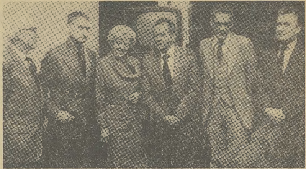
Laureaci konkursu na Książkę Roku o Krakowie